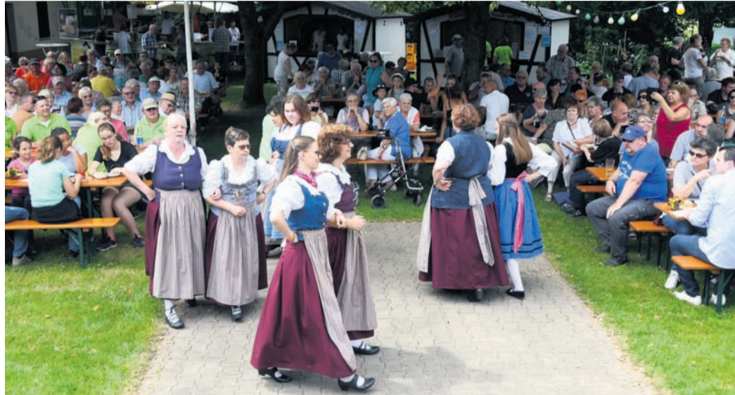
Die Volkstanzgruppe - hier bei einem Auftritt im Biergarten der Wandergesellschaft „Frisch-Auf Münster“ - pausiert derzeit.

Münster (jedö) An großen Jubiläen mangelt es Münster 2022 wahrlich nicht: Die Feuerwehr wird 150, die DJK Blau-Weiß 100 - und die Wandergesellschaft „Frisch-Auf“ macht ebenfalls das Jahrhundert voll. Der Mehrspartenverein, der etwa zum Volkswandern oder zur „River Night“ auch viele Externe in sein Wanderheim und den idyllischen Biergarten nahe der Gersprenz lockt, hat zum „Runden“ viele Pläne geschmiedet.