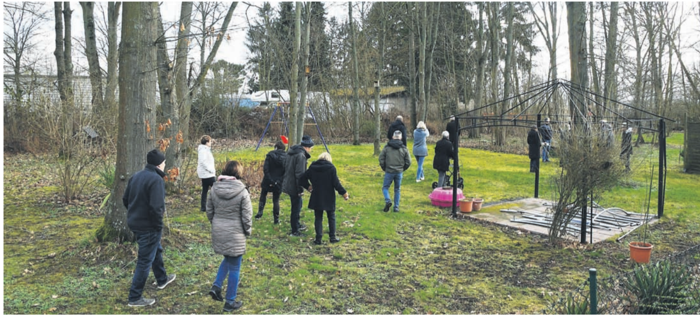
Den kleinen Mischwald am Werlacher Weg mit den teils mehr als 40 Jahre alten Bäumen wollen die Anwohner der benachbarten Heinrich-von-Kleist-Straße auch nach einem Gespräch mit dem Bürgermeister noch nicht aufgeben.