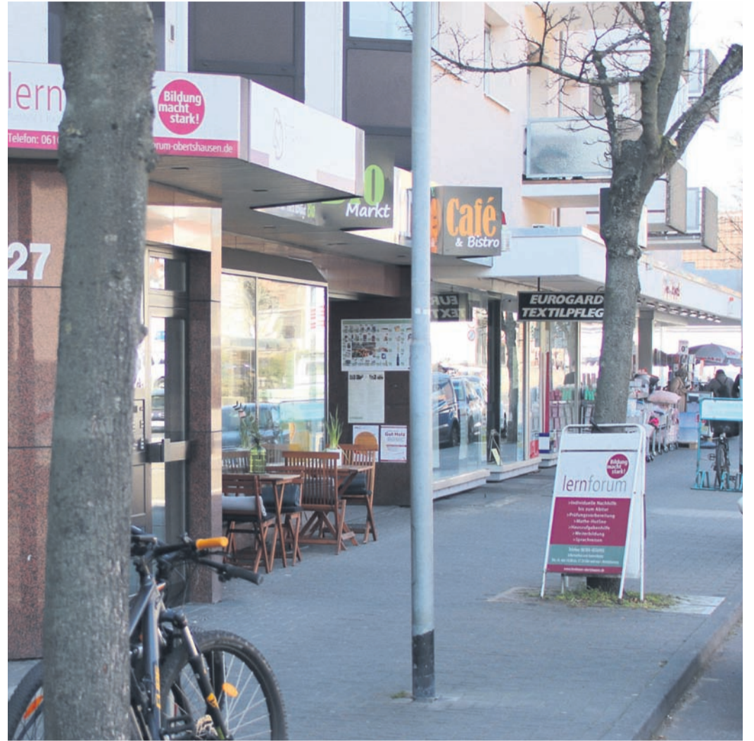
Was wünscht sich die Obertshausener Bevölkerung für eine attraktive Innenstadt?