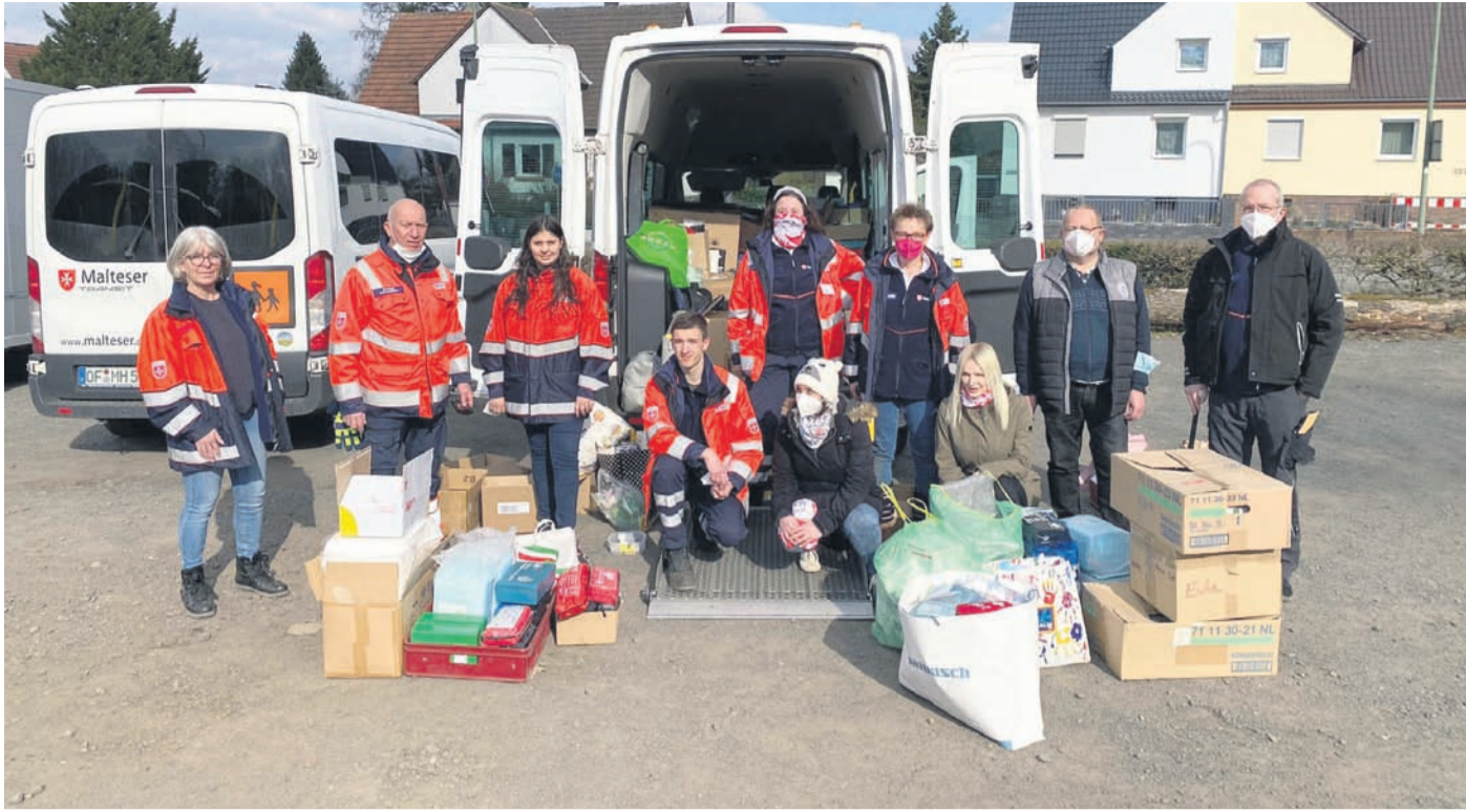
Die Malteser in Stadt und Kreis Offenbach riefen die Bürgerinnen und Bürger in der vergangenen Woche dazu auf, Verbandsmaterial für Wischgorod in der Ukraine zu spenden.