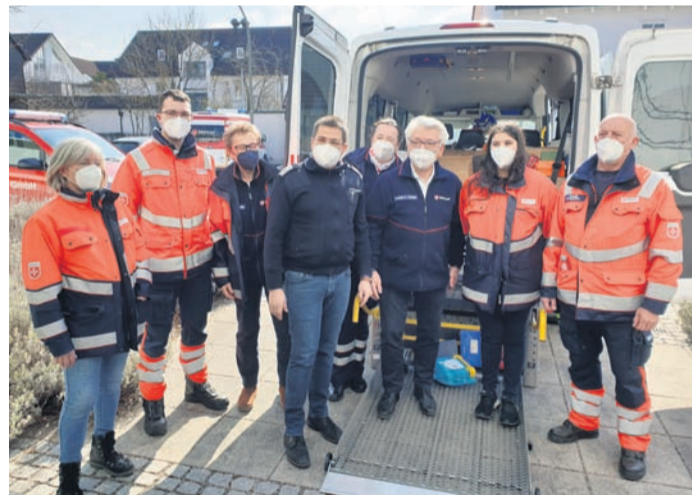
Ankunft in Eichenau.

Malteser Hilfsdienst e. V. IBAN: DE10 3706 0120 1201 2000 12 S.W.I.F.T.: GENODED 1PA7 Stichwort: „Ukraine-Hilfe“ Oder online: www.malteser.de Aktion Deutschland Hilft e. V.: Konto IBAN: DE62 3702 0500 0000 1020 30 Stichwort: „Nothilfe Ukraine“ www.aktion-deutschland-hilft.de