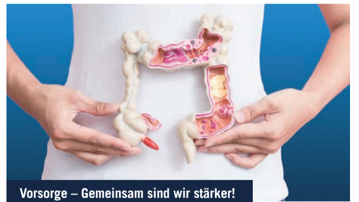
Vorsorge – Gemeinsam sind wir stärker!

Die Teilnehmerzahl ist begrenzt, eine Anmeldung in der jeweiligen Bücherei ist erforderlich: Stadtbücherei Hausen (Tempelhofer Straße), Telefon: 06104 7034302, E-Mail: buecherei.hausen@obertshausen.de ; Bücherei Obertshausen (Kirchstraße), Telefon: 06104 7034301, E-Mail: buecherei.obertshausen@obertshausen.de .