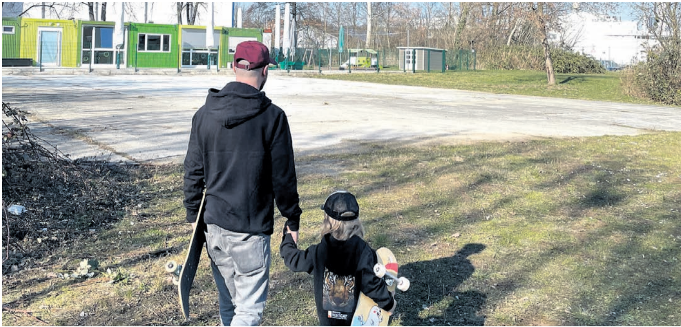
Auf dem Gelände zwischen der städtischen Sporthalle an der Rodaustraße und der Schubertstraße könnte mit dem Skate- und Jugendpark bereits 2023 ein neuer Treffpunkt entstehen.

Planungen für Skate- und Jugendpark sollen im April beginnen