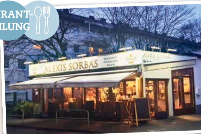
Der Glaskasten wird am Abend wunderschön beleuchtet.