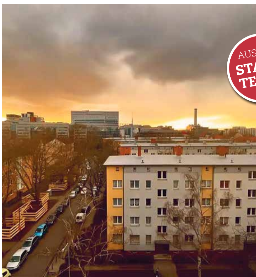
Der Blick über Niederrad zeigt viele Wohnhäuser bis hinter ins Lyoner Quartier.