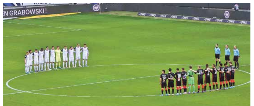
Die 22 Spieler vom VfL Bochum und der Eintracht gedachten Grabi mit einer Schweigeminute.

Jürgen Grabowski verzauberte durch Dribblings und Tore – ein persönlicher Abschied von einem der besten Fußballer, der jemals bei Eintracht Frankfurt gespielt hat