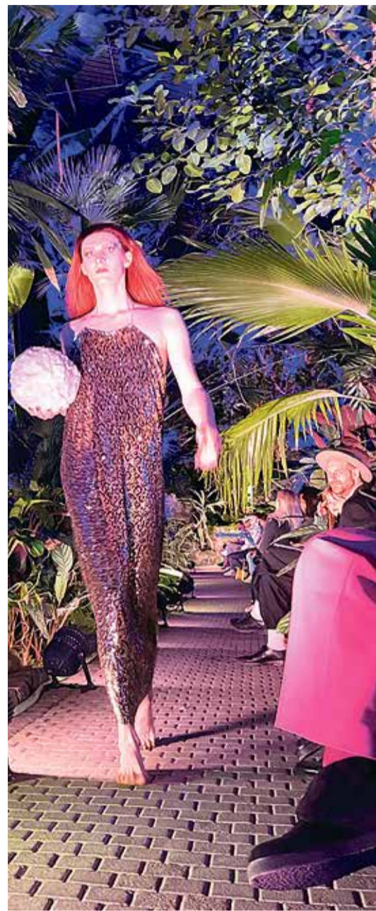
Die Models laufen durch das besondere Ambiente des Palmengartens.

Tickets für die Modenschau zwischen Palmen und Sträuchern gab es nicht zu kaufen. Beide Durchläufe am Nachmittag und am Abend wurden live auf dem Instagram-Account von Samuel Gärtner gestreamt.