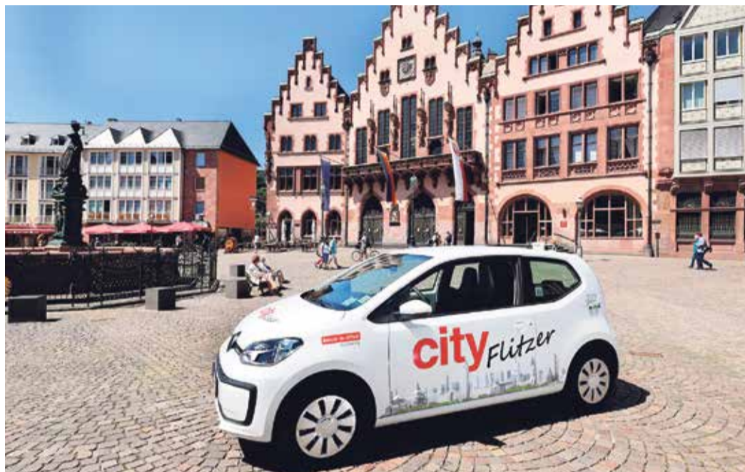
Der cityFlitzer trägt positiv zum Klimaschutz bei, entlastet den Verkehr und spart Parkraum.