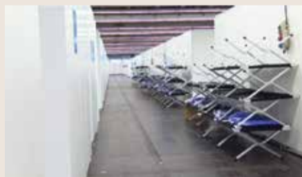
Erstaufnahmeeinrichtung in der Frankfurter Messe

die Organisation für Migration in Genf am vergangenen Dienstag. Meist in westliche Nachbarländer, nach Polen, in die Slowakei, nach Ungarn, Rumänien und in die Republik Moldau. Aber, die Zahl der Schutzsuchenden wird weiter steigen, auch in Deutschland. Um darauf so gut, wie möglich vorbereitet zu sein, hat die Stadt Frankfurt vor rund einer Woche ein Erstaufnahmelaager in der Messe eröffnet - mit Schlafkabinen, Sanitäranlagen und einem besonderen Beschäftigungsangebot für Kinder. Geplant ist, dass die Geflüchteten hier nur wenige Tage verbringen, bevor sie dann auf andere Unterkünfte und Kommunen verteilt werden. Künftig sollen in der Messe 2000 Menschen Platz finden.