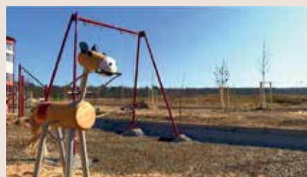
Spielplatz im neuen Rennbahnpark in Frankfurt

Die Galopprennbahn in Frankfurt Sachsenhausen an der Grenze zu Niederrad wurde bereits in den 1860er Jahren eröffnet. Lange Zeit war die Reitsportanlage ein echter Zuschauerparadies. Anfang der 1990er ging es allerdings bergab mit dem Interesse, die Wetteinsätze brachen drastisch ein und 2008 meldete der Frankfurter Renn-Klub Insolvenz an. 2015 fand schließlich das letzte Pferderennen statt. Seit letztem Jahr wird auf dem historischen Gelände ein neuer, großangelegter Park gebaut und die Pferde hier sind nur noch aus Holz. Nach sieben Monaten Bauzeit stehen die ersten Spielgeräte. Auch die Sport-Anlage ist so gut wie fertig. Bis aber die Arbeiten auf dem neun Hektar großen Bürgerpark komplett abgeschlossen sein werden, wird es noch ein paar Monate dauern. In das Projekt investiert die Stadt Frankfurt rund 5,4 Millionen Euro. Der Bürgerpark nimmt von dem gesamten ehemaligen Rennbahnareal circa ein Drittel ein. Im Osten geht die neue Anlage in den Bannwald über. Der Rest der historischen Fläche ist an den Deutschen Fußball-Bund vergeben. Dort soll im Sommer ein neues Leistungszentrum eröffnet werden.