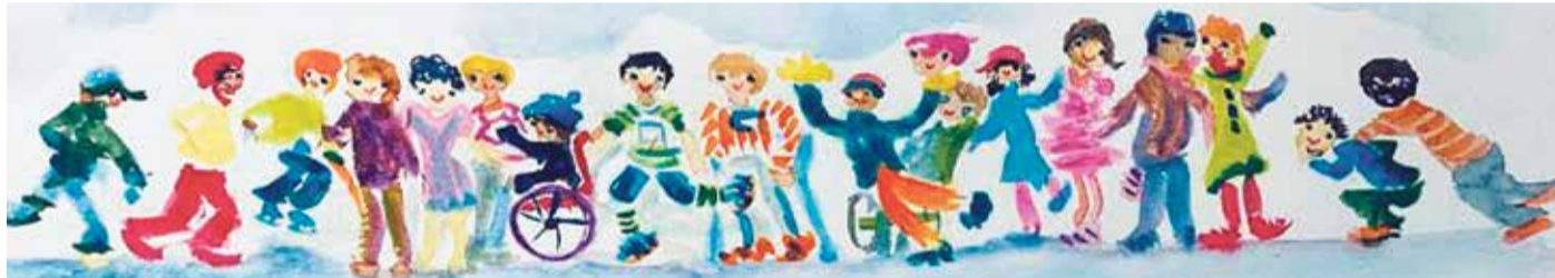
Der Web-Banner ist aus der Feder von Trixi aus der Galeriebrücke54.