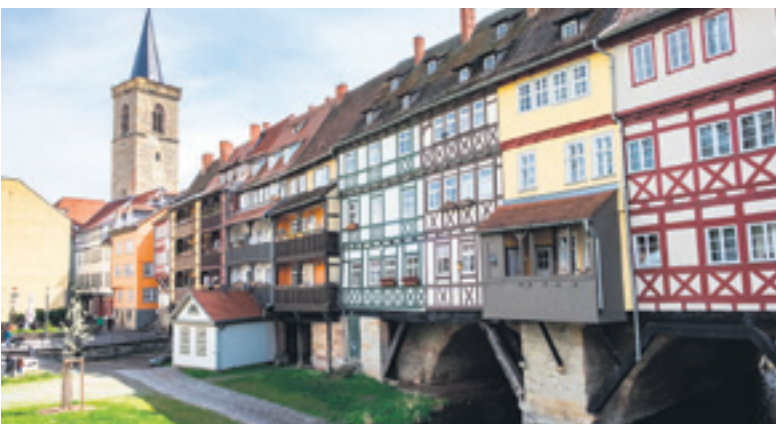
Die Krämerbrücke ist die längste bewohnte Brücke in Europa.

Die Städtische Tourismusinformation liegt direkt in der Innenstadt am Benediktusplatz. Diese ist täglich von 10:00 bis 18:00 Uhr geöffnet. Lediglich an Sonn- und Feiertagen ist sie nur bis 15:00 Uhr geöffnet. Telefonisch erreichbar ist das Team unter 0361/66440 oder im Internet unter: www.erfurt-tourismus.de