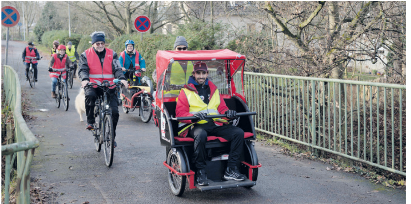
Gemeinsame Übungsfahrt in Kranichstein.

Kombiniertes Fahrschul- und Stammtischwochenende am 8. und 9. April