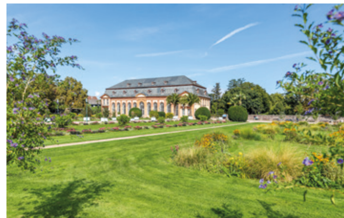
Orangerie Darmstadt ©#visitrheinmain, David Vasicek.

Welche Geschichte steckt hinter den wichtigsten Innenstadt-Sehenswürdigkeiten, wie zum Beispiel Luisenplatz und Residenzschloss? Antworten gibt es bei der 120-minütigen Führung, die auf der Mathildenhöhe endet, immer sonntags um 11 Uhr in deutscher und/oder englischer Sprache. Treffpunkt ist am Darmstadt Shop auf dem Luisenplatz. Die Karte kostet 10 Euro (ermäßigt 7 Euro). Tickets sind nur im Vorverkauf erhältlich.