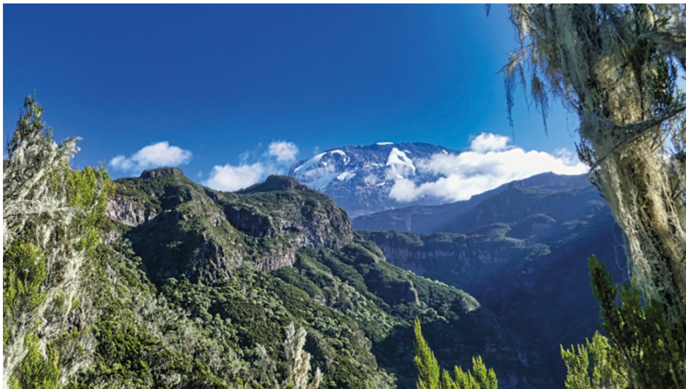
Der spektakuläre Umbwe-Kamm vor dem 5.895m hohen schneebedeckten Gipfel des Kilimanjaro.