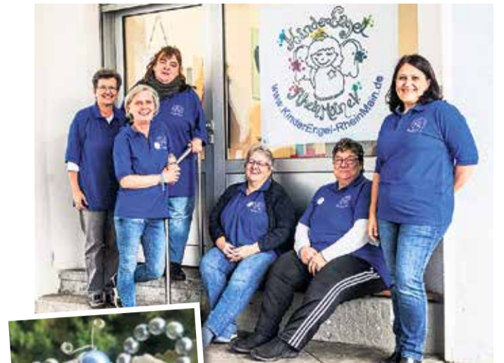
Das Team der KinderEngel vor ihrer KinderEngelZentrale in der Schäfflestraße 27.