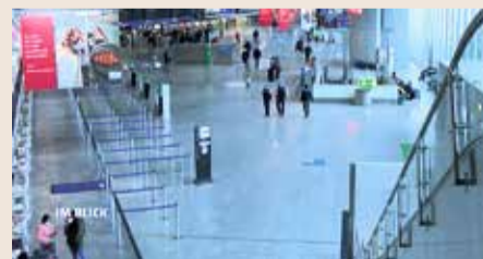
Leere Abflughalle am Frankfurter Flughafen.

Im Tarifstreik zwischen der Gewerkschaft Ver.di und dem Bundesverband der Luftverkehrsgesellschaften gibt es nach wie vor keine Einigung in Sachen Tarifverträge der Sicherheitskräfte. „Sicherheit sei nicht umsonst“ sagt Ver.di. Dem Bundesverband sind die Forderungen allerdings zu hoch. Am Frankfurter Flughafen führte diese Situation zum erneuten Streik – lediglich Transitpassagiere konnten abheben.