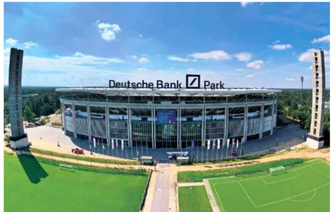
Die Außenansicht des Deutsche Bank Parks 2020.

SACHSENHAUSEN (TL) | Wenn die Eintracht spielt, ist der ganze Stadtwald in Sachsenhausen-Süd voll mit Fans. Man erkennt sie an ihren rot-schwarzen Fan-Schals und typischerweise auch an dem Bier in der Hand. Sie alle vereint ein Ziel, den Wallfahrtsort ihres Vereins, das Frankfurter Waldstadion. Heute besser bekannt unter dem Namen Deutsche Bank Park. Doch seit wann gibt es das Waldstadion überhaupt und warum entschied sich Frankfurt dafür, solch eine große Sportstätte zu erbauen? „Der Frankfurter“ ist den wichtigsten Fragen auf der Spur.