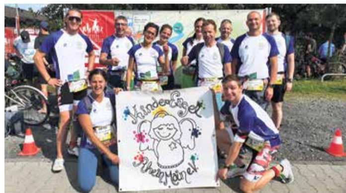
Der 10-Freunde-Triathlon 2021 hat Erfolg gebracht. Der Verein wünscht sich für die Charity Aktion am 19. Juni wieder viele Zuschauer und Spenden.