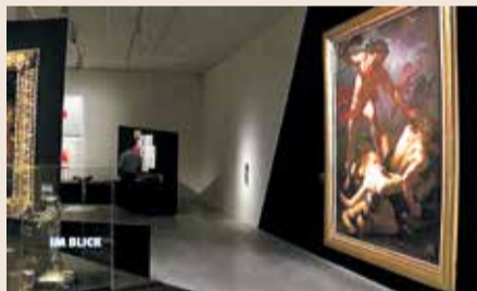
Ausstellung „Rache. Geschichte und Fantasie“ im Jüdischen Museum Frankfurt.

Was haben biblische Geschichten, rabbinische Schriften und Filme von Quentin Tarantino gemeinsam? In vielen dieser Werke geht es um das Thema Rache. Also eine persönliche Vergeltung für eine als ungerecht empfundene Tat. Welche Rolle Rache in der Geschichte und in unserer Fantasie spielt, damit setzt sich eine neue Ausstellung im jüdischen Museum Frankfurt auseinander. Beleuchtet wird hier unter anderem der Satz „Auge um Auge, Zahn um Zahn“, der nicht nur in der Bibel auftaucht, sondern auch in einigen rabbinischen Schriften. Die Redewendung bietet Raum für Interpretation: Geht es dabei um angemessenen Schadensersatz oder doch um kaltblütige Rache? Ein eindrucksvolles Ausstellungsstück ist eine Requisite aus dem Film „Inglourious Basterds“ des US-amerikanischen Regisseurs Quentin Tarantino Highlight: Ein Baseballschläger. Insgesamt gibt es in der Ausstellung 80 verschiedene Exponate zu sehen – von historischen Wandgemälden – bis hin zu Comics und Videospielen aus der Popkultur. Ergänzt wird das Ganze durch virtuelle Angebote und zahlreiche Veranstaltungen.