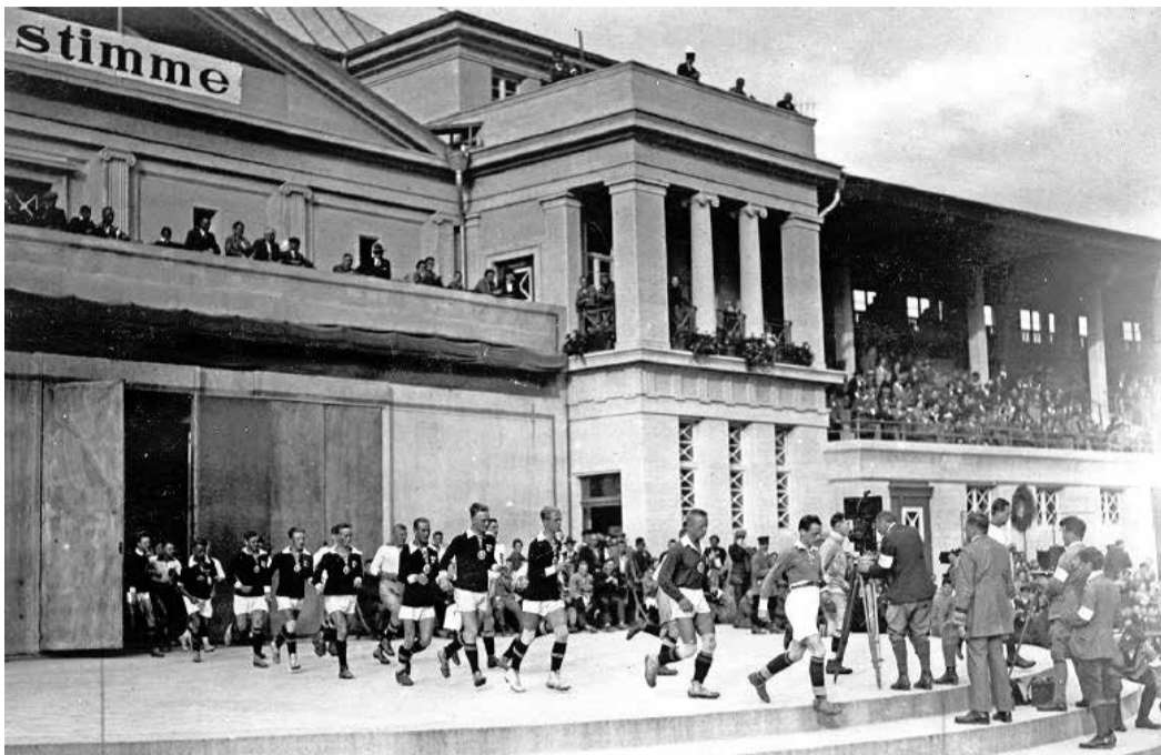
Fußballspiel Deutschland gegen Finnland bei der Arbeiterolympiade 1925: Einlauf der Mannschaften vor der Haupttribüne.

Heimat der Eintracht und Uneinigkeit über Namensrechte