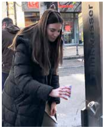
Ab jetzt können auch Passanten diese Trinkbrunnen ausprobieren.