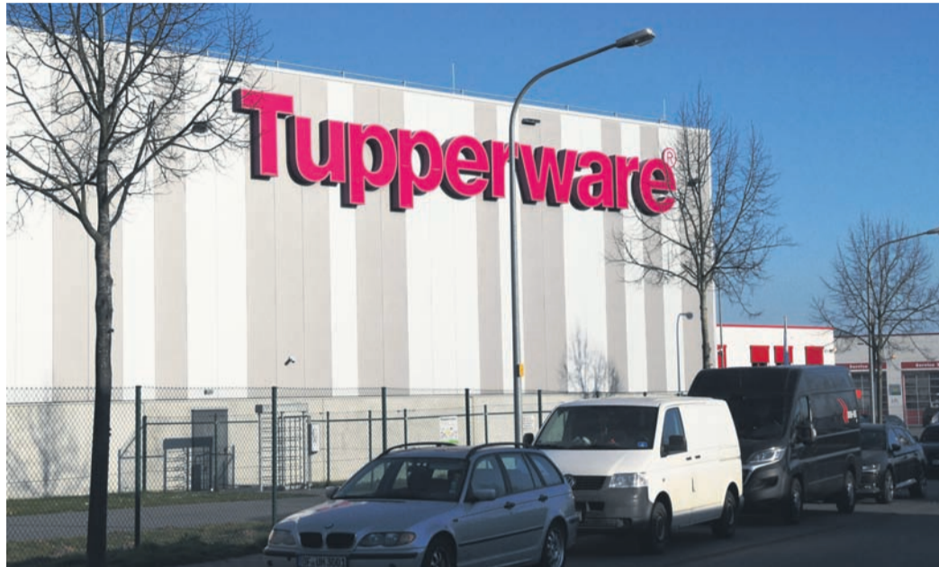
Das weithin sichtbare Tupperware-Logo an der größten Halle im Eppertshäuser „Park45“ - die Halle gehört einer Investorengruppe, Tupperware Deutschland ist dort noch bis Ende Juni Mieter einer Teilfläche - wird bald verschwinden. Der amerikanische Mutterkonzern konzentriert die europäischen Logistikstandorte künftig in Polen und Belgien.