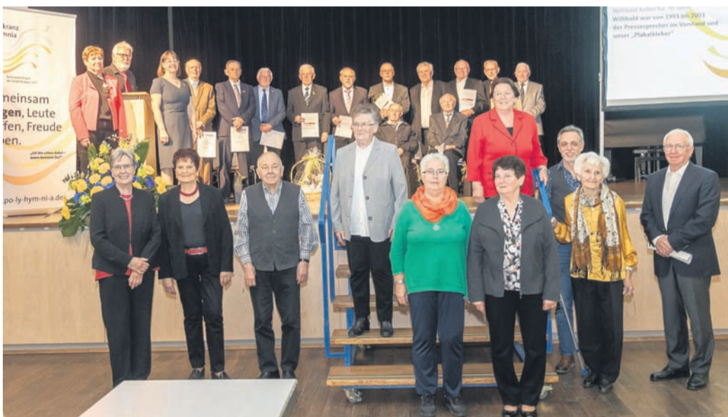
Der Dank bei der akademischen Feier galt den langjährigen Mitgliedern.