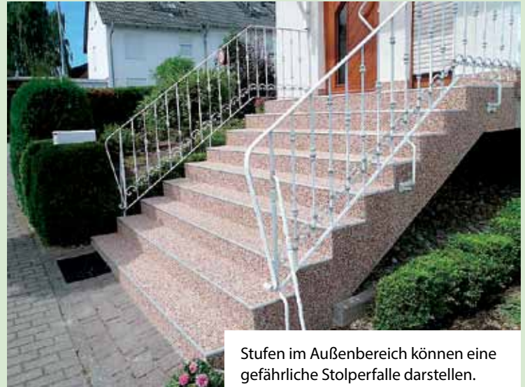
Stufen im Außenbereich können eine gefährliche Stolperfalle darstellen. Mit einer Sanierung und einem neuen Belag werden sie wieder trittsicher.

Hausbesitzer schieben die Sanierung alter Treppen häufig vor sich her, weil sie hohe Kosten und viel Schmutz befürchten. Dabei lassen sich abgenutzte Stufen oft auch auf einfache und zeitsparende Weise sanieren. So können Platten aus vorgefertigten Natursteinelementen etwa vom deutschen Hersteller Renofloor häufig direkt auf den alten Belag verlegt werden. Quarz- oder Marmorgranulat ist dabei in einem klaren Harz gebunden. Somit sind die neuen Stufen lediglich acht Millimeter stark und passen oft auf das vorhandene Material - ohne