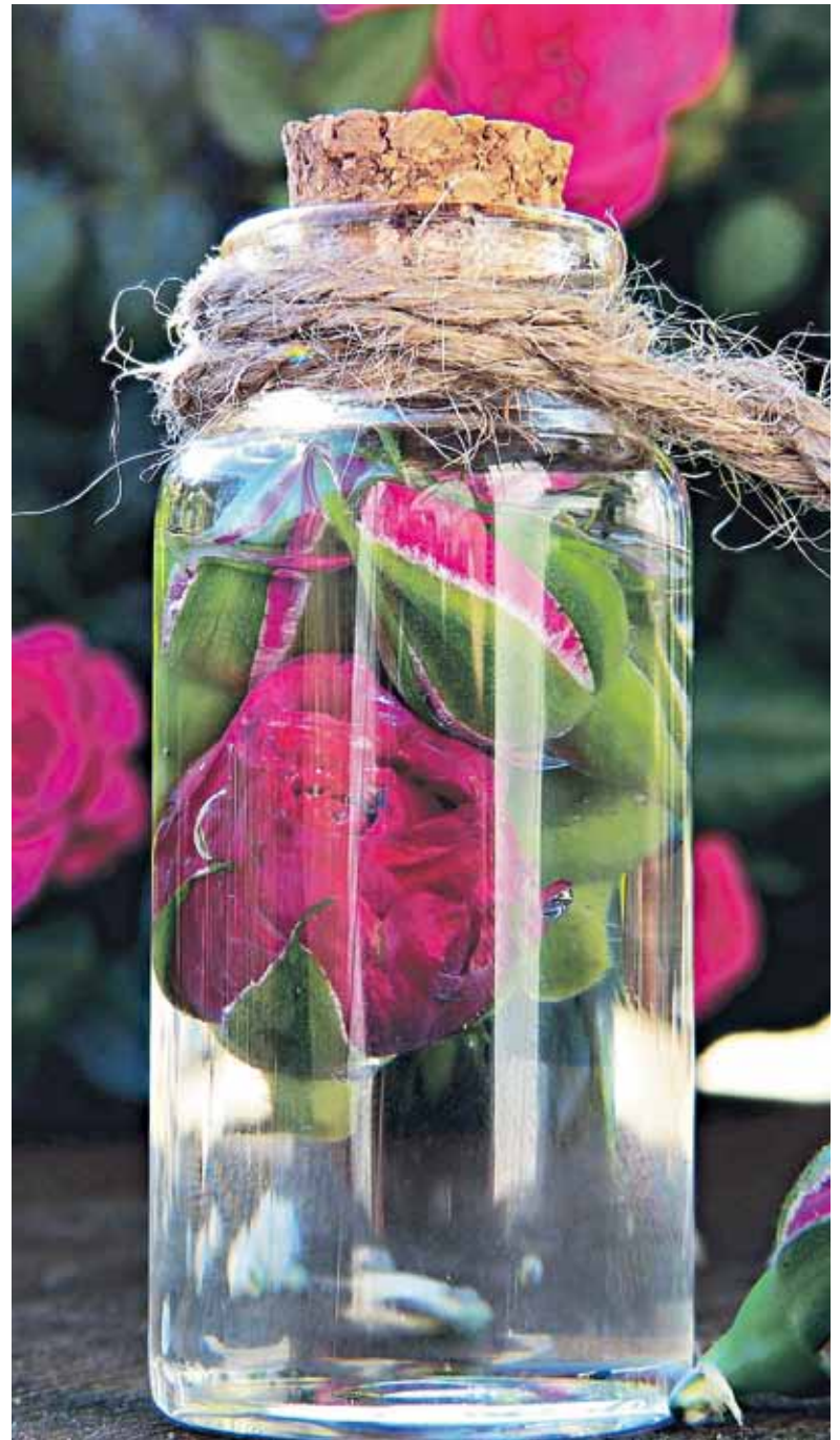
Rosenwasser kann man ganz leicht selbst herstellen und ist auch noch dekorativ.

Ganz exquisit ist selbst gemachtes Rosenwasser. Hybriden aus den Rosengruppen von Rosa x centifolia oder Rosa x damascena eignen sich besonders dafür. Dazu 150 g Rosenblütenblätter vom weißen Blattansatz befreien und mit einem Liter siedendem Wasser übergießen und eine Stunde ziehen lassen. Genutzt wird es zum Verfeinern von Speisen oder als Pflegeprodukt für Haut und Haar. Ob selbst gemachter Sirup, Kompott oder Gelee – eine Vielzahl von Rezepten hilft auch Ungeübten dabei, Obst und Gemüse aus dem eigenen Garten zu Köstlichkeiten zu verarbeiten.