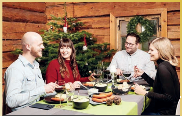
Endlich wieder unbeschwert mit Freunden Weihnachten feiern: Heiligabend kommt dabei oft Kartoffelsalat mit Würstchen auf den Tisch.

(djd). Weihnachten ist das große Fest der Rituale, in vielen Familien werden dabei jahrzehntealte Traditionen gepflegt. 2020 aber war alles anders: Treffen mit lieben Angehörigen oder Freunden waren entweder gar nicht oder nur unter sehr erschwerten Bedingungen möglich. Umso mehr freuen sich die Menschen in diesem Jahr auf die Rückkehr zu einer gewissen Normalität, vor allem auch beim Thema Essen. Am 24. Dezember kommt in vielen Familien abends Bockwurst mit Kartoffelsalat auf den Tisch. Umfragen bestätigen immer wieder, dass dieses einfache Gericht an Heiligabend am beliebtesten ist. Ein möglicher Grund: Vor Weihnachten hat man genug Stress mit dem Kauf und Einpacken der Geschenke und den Vorbereitungen auf die Festtage. Da ist jeder froh, wenn er sich Heiligabend nicht auch noch stundenlang in die Küche stellen und Rezepte wälzen muss. Geschmacklich ist Bockwurst mit Kartoffelsalat ebenfalls in den meisten Familien beliebt: Das Gericht schmeckt Groß und Klein. Die Zubereitungsarten für den Kartoffelsalat können sehr unterschiedlich