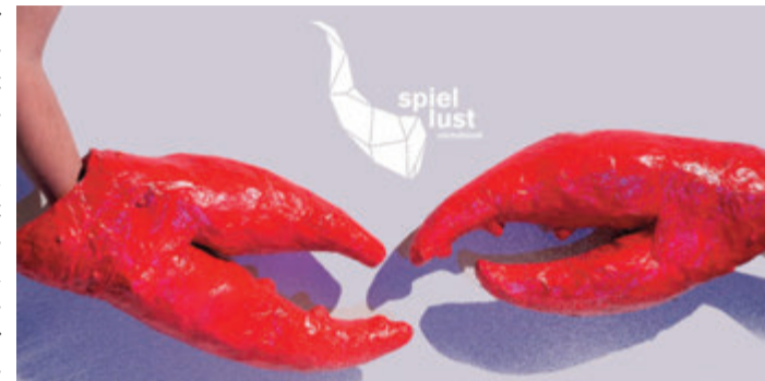
Das erste Stück 2022 ist Sabeth.

Michelstadt. Der Michelstädter Theaterverein „Spiellust“ eröffnet seine Spielsaison 2022 mit einer Produktion in der Odenwaldhalle in Michelstadt.