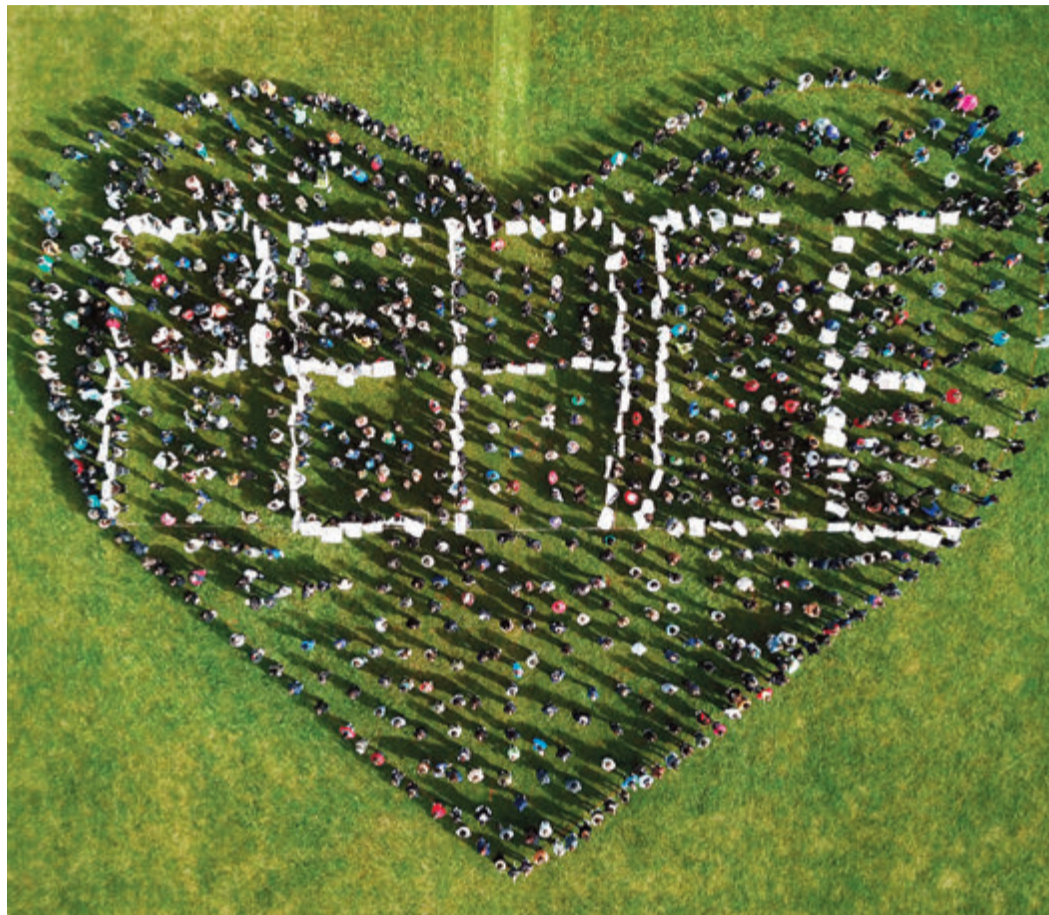
1100 Schüler beteiligten sich an der Aktion.