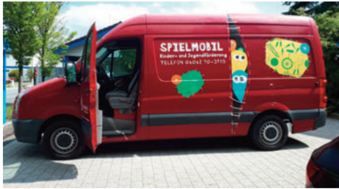
Das Spielmobil der Kinder- und Jugendförderung ist erneut in den Sommerferien unterwegs und sucht noch engagierte Teamerinnen und Teamer für die Betreuung der Kinder.

Die Einsatzmöglichkeiten im Spielmobil sind jeweils eine bis