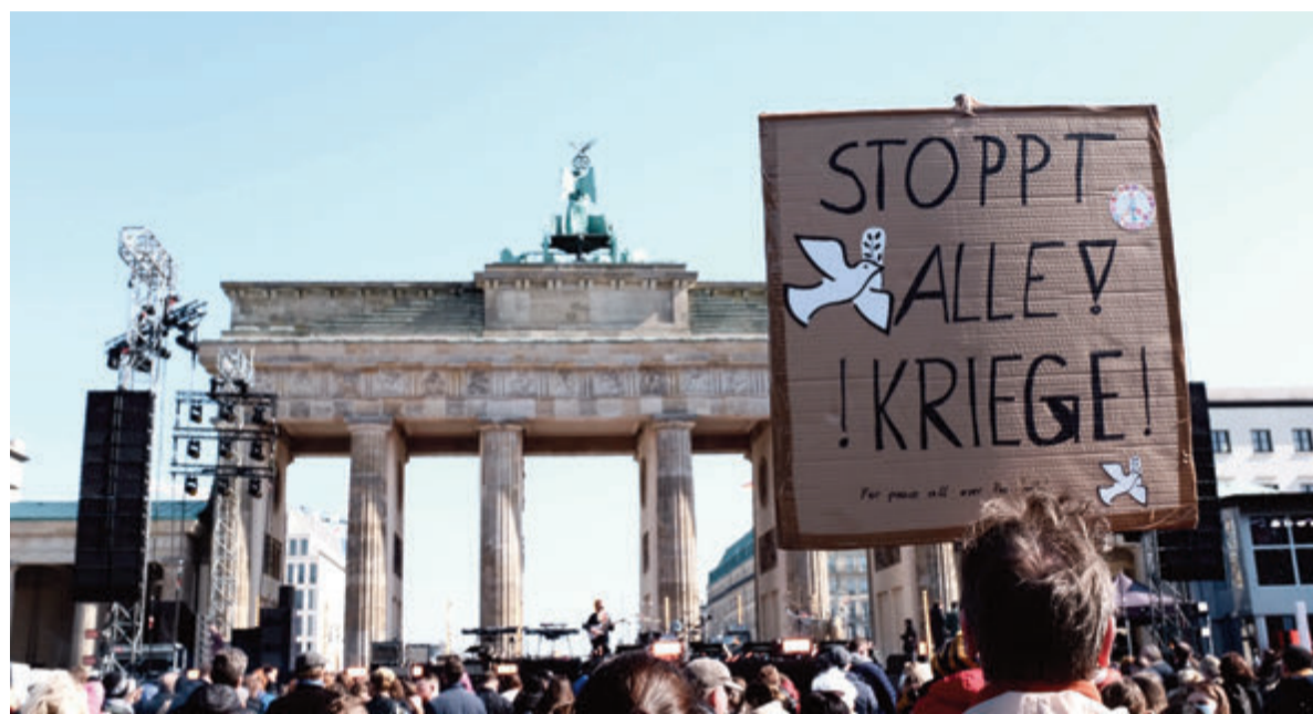
Vor dem Brandenburger Tor versammelten sich bis zum Abend 300.000 Menschen.