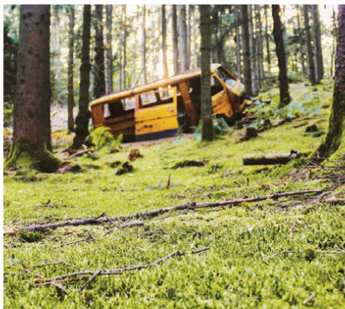
Der gelbe VW-Bus im Mossautaler Wald.

Mossautal. Von Spaziergängern und Mountainbikefahrern oft übersehen, blitzt etwas Gelbes mitten im Mossautaler Wald zwischen den Bäumen hervor. Ein alter, von Moos bewachsener VW LT 28 Kastenwagen. Einer von vielen vergessenen Orten, sogenannten „Lost Places“ in Deutschland. Die Community, also Gemeinschaft, die ihren Ursprung in den 70er-Jahren in den USA hat, bezeichnet sich selber als „Urban Explorer“ oder kurz „Urbexer“, also als Personen, die alte verlassene Orte erkunden. Vor allem seit Beginn der Corona-Pandemie zeichnet die Community einen immer stärkeren Zuwachs. Auch die 25-jährige Michelstädterin Marie (Name von der Redaktion geändert) hat ihre Leidenschaft für das Erkunden von „Lost Places“ in der Pandemie entdeckt. „Mich haben verfallene, alte Gebäude und Plätze schon immer fasziniert“, sagt sie. Über Videos auf YouTube sei sie auf die Community aufmerksam geworden. „Ich wusste vorher nicht, dass es eine bestimmte Bezeichnung für das Hobby gibt.“ Neue „Lost Places“ finden würde sie meist durch spezielle Facebook-Gruppen oder im Austausch mit anderen Leuten, die der gleichen Leidenschaft nachgehen. „Es gibt den sogenannten Urbexer-Kodex“, man sollte keine genauen Koordinaten oder Standorte weitergeben. „Hinterlasse nichts außer Fußspuren“, so sei der Leitsatz der Community. Diese möchte Vandalismus verhindern, um die verlassenen Plätze zu erhalten. „Aber es gibt immer schwarze Schafe“, meint