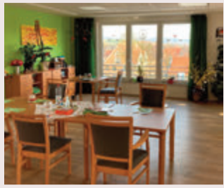
Das Seniorenzentrum Römerbad in Groß-Bieberau.

Unseres Angebotes sein. Die Tagespflege bietet für sonnige Tage eine große Terrasse, damit die Betreuungsangebote im Freien stattfinden können und einen Ruheraum, um die Füße nach dem Mittagessen hochzulegen. Mittagessen erhalten wir aus der Küche aus Reinheim. Hier kann jeder Gast aus drei verschiedenen Menüs wählen.