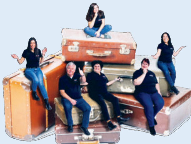
Das Team von Reisestudio-Schindler