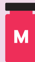
Spikevax® (Moderna) für Menschen ab 30 Jahren

Für Ihre 2. Auffrischimpfung wird einer der folgenden Impfstoffe empfohlen: