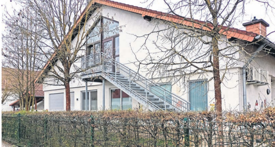
Die Kita St. Sebastian verfügt über Mängel im Brandschutz. Ein Teil wurde vom Bauhof schon behoben, um den Rest kümmern sich in den nächsten Tagen Fachfirmen.