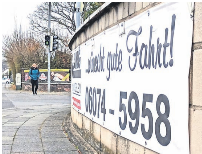
Gibt es in Eppertshausen zu viele unschöne Werbebanner? Eine neue Gestaltungssatzung für Werbeanlagen könnte dies bald ändern.

der Kreis Darmstadt-Dieburg für die Flüchtlinge aufkommt und somit eine Rückerstattung stattfindet. Die Städte und Gemeinden können die Gelder allerdings nur dann ausbezahlen, wenn sie im Haushalt bemerkt sind. Die Gesamtfinanzierung funktioniert so, dass die Landkreise vom Land Hessen für jede geflüchtete Person, die in einer Kommune gemeldet ist, einen Pauschalbetrag in Höhe von 952 Euro erhalten. Hiervon werden die Kosten für den Lebensunterhalt (352 Euro) sowie die Krankenversicherung (200 Euro) abgezogen. Die verbleibenden 400 Euro gehen an die Kommunen für ihre Ausgaben bezüglich Unterkunft und sozialer Betreuung. Die Eppertshäuser Gemeindevertreter bewilligten einstimmig die Bereitstellung der 250 000 Euro. Als Grundlage der Berechnung wurden 70 Personen à 400 Euro für die Monate April bis Dezember 2022 herangezogen, was unterm Strich 252.000 Euro macht. Die Gegenfinanzierung findet, wie bereits erwähnt, durch „außerordentliche Erträge“ vom Landkreis statt.