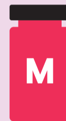
Spikevax® (Moderna) für Menschen ab 30 Jahren

Für Ihre 2. Auffrischimpfung wird einer der folgenden Impfstoffe empfohlen: