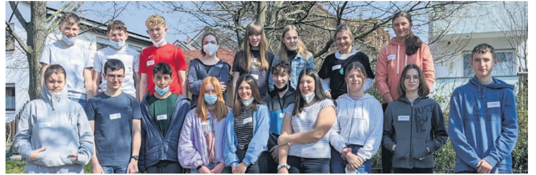
Die Konfirmandinnen und Konfirmanden aus Eppertshausen, Münster und Altheim.

Barren“ in der Jahnstraße 2 in Münster. Der Spielabend findet unter den aktuellen Corona-Regeln statt.