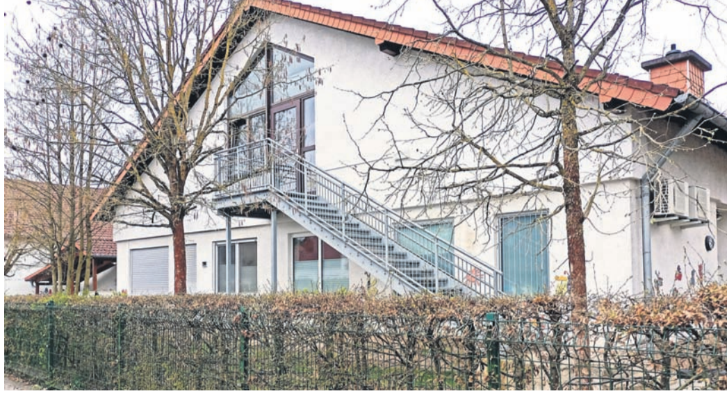
Die Kita St. Sebastian verfügt über Mängel im Brandschutz. Ein Teil wurde vom Bauhof schon behoben, um den Rest kümmern sich in den nächsten Tagen Fachfirmen.