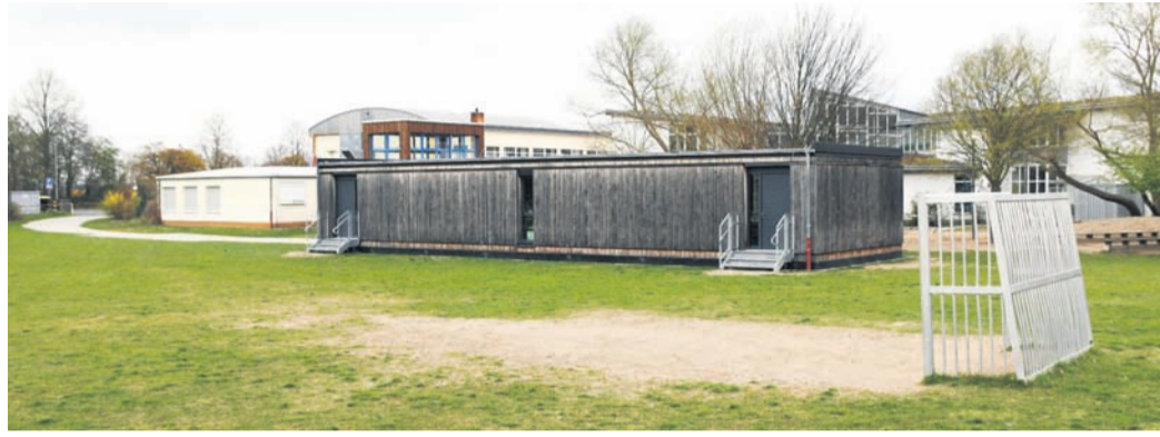
Dort, wo sich derzeit noch der Bolzplatz befindet, soll hinter der Regenbogenschule in Modulbauweise für drei Millionen Euro die neue Altheimer Kita entstehen, die interimweise den Kids der Kita St. Michael und danach dauerhaft den „Blumenkindern“ zur Verfügung stehen soll.

Denn dort, auf dem Bolzplatz hinter der Regenbogenschule, soll ein neues Gebäude in Modulbauweise (also Fertigbauweise, was eine kurze Herrichtungszeit bedeutet) entstehen. Das ist auf den ersten Blick zwar deutlich teurer als die Anmietung von Containern - drei Millionen Euro für den Neubau in Altheim stehen rund 1,5 Millionen Euro für die Lösung