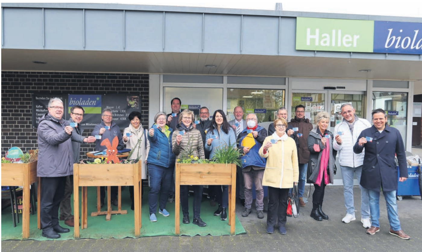
Auftakt für die Punktekarte in Rodgau mit strahlenden Machern und Mitmachern.

Unabhängiges Wochenblatt · Amtsverordnungsblatt der Stadt Rodgau