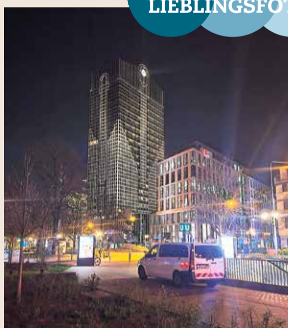
Dieses schöne Foto hat uns Frauke Braka aus dem Westend zugeschickt. Es zeigt die Hochhäuser an der U-Bahn-Station Westend am späten Abend. Vielen Dank dafür!