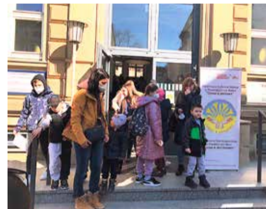
Die Samstagsschule hat ihr Zuhause in der Julius-Leber-Schule gefunden.

mit humanitärer Hilfe unterstützen, sowie die Geflüchteten in Fuldaer Kreis für Obhut sorgen. Unter anderem wurde die Möglichkeit der Eröffnung einer Filiale der Frankfurter Samstagsschule in Fulda diskutiert.“