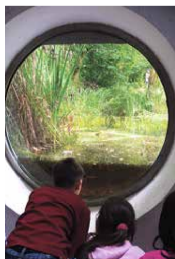
Das Bullauge im StadtWaldHaus lässt in der kleinen See blicken.

nie 17 zu erreichen. Von der Station Oberschweinstiege sind es noch rund 15 Minuten Fußweg. Mit dem Auto erreicht man das StadtWaldHaus über die Autobahnabfahrt Frankfurt-Süd von der A3 aus und dann weiter Richtung Neu-Isenburg. Es stehen kostenfreie Parkplätze an der Isenburger Schneise zur Verfügung. Weitere Informationen sind unter der Telefonnummer 069/683239 oder im Internet unter stadtwaldhaus-frankfurt.de erhältlich.