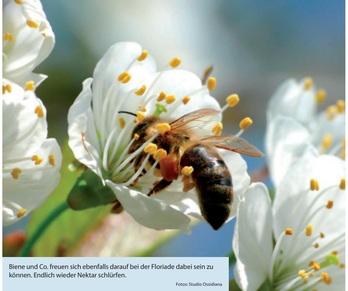
Biene und Co. freuen sich ebenfalls darauf bei der Floriade dabei sein zu können. Endlich wieder Nektar schlürfen.

Die Floriade Expo 2022 verbindet Nationen, internationale Unternehmen und Nichtregierungsorganisationen aus der ganzen Welt mit zwei Millionen erwarteten Besuchern. Zu sehen gibt es wunderbare Gärten renommierter Designer, aber auch realisierte Entwürfe von Studenten. Das Arboretum wird ein großes Highlight werden; eingeteilt in 192 gleich große Felder werden alphabetisch und botanisch sortiert, Tausende Bäume, Sträucher, Stauden, Einjährige und Zwiebelblumen Beispiele für ein neues Stadtgrün geben. Es bildet heute schon die Infrastruktur für ein neues Stadtviertel von Almere, das hier nach der Expo entstehen soll. Ein riesiges Gewächshaus mit einer Fläche von 10.000 Quadratmetern zeigt, wie Zier- und