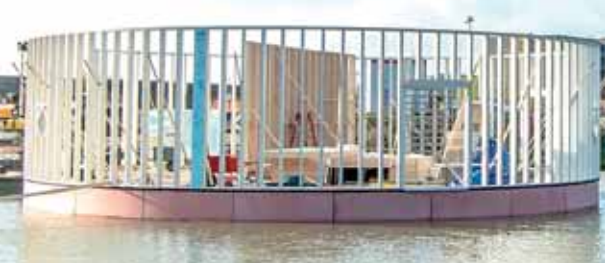
Der Kunstpavillon der Floriade 2011. Lesen Sie mehr auf Seite 2.