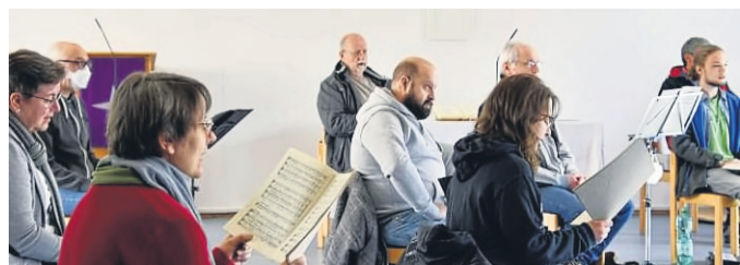
Die Sängerinnen und Sänger des Kammerchores Cantus Schlüchtern bereiten sich auf die Aufführung der Matthäus-Passion vor.