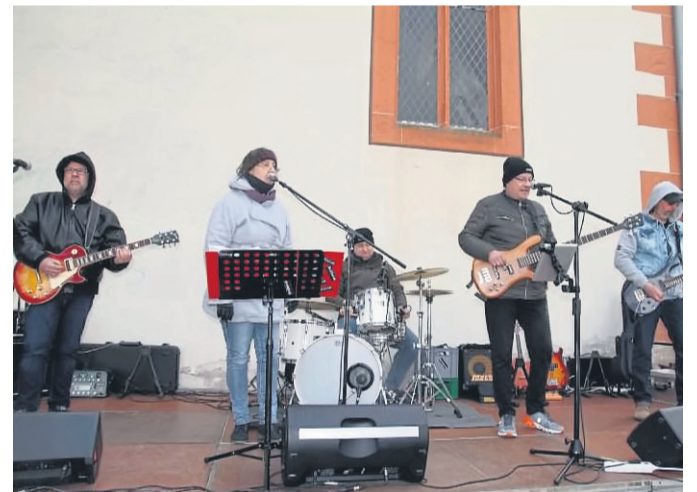
Die Band „BackYard28“ rockt den Kumpen.