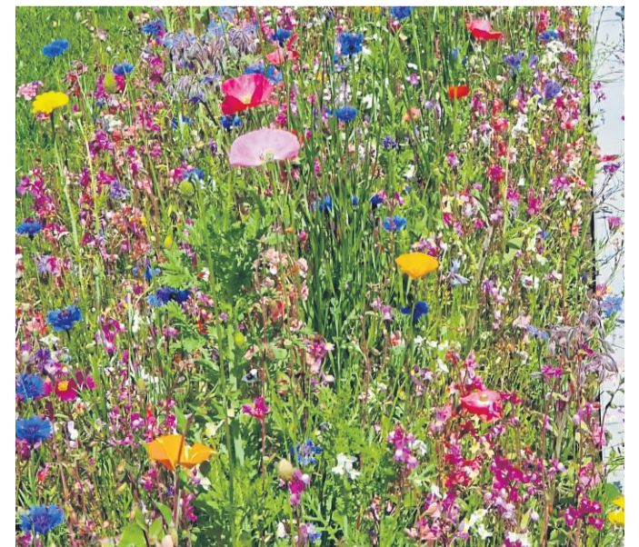
Die Aktion „Blütenzauber mit dem Imkerverein Steinau“ geht in die nächste Runde.