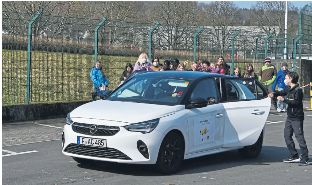
Bei einer Notbremsung wirken enorme Kräfte auf den Körper, wie die Schülerinnen und Schüler ordnungsgemäß gesichert als Beifahrer erleben konnten.