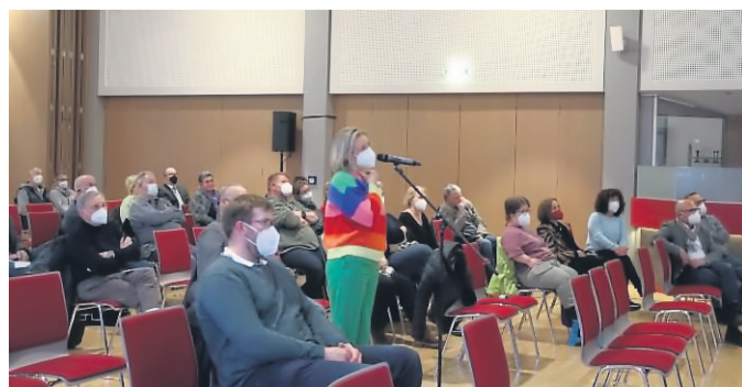
50 Besucher verfolgten die Bürgerversammlung.

ßend wird der Straßenbelag erneut. In 2024 werde die Zufahrt zur Autobahn erneuert und die Autobahnausfahrt Schlüchtern Süd voll gesperrt, teilte Tanja Mittag mit. Der Verkehr werde dann über Schlüchtern Nord umgeleitet. Danach starteten Schlüchterner in Elm, Hutten und Gundhelm. Auf die Schlüchterner kämen in den kommenden Monaten und Jahren erhebliche Verkehrsbehinderungen zu. CS