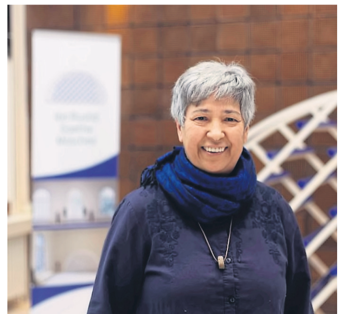
Seyran Ates, weibliche Imamin und Mitbegründerin der Ibn-Rushd-Goethe-Moschee.

SCHLÜCHTERN – Der Turnverein Schlüchtern teilt mit, dass ab dem 25. April wieder jeden Montag das Kinder-Turnen (1. bis 4. Schuljahr) stattfindet. Das Jungen-Turnen findet von 15 bis 16 Uhr und das Mädchen-Turnen von 16 Uhr bis 17 Uhr statt. Mittwochs findet dann auch wieder das Eltern-Kind Turnen von 16 bis 17 Uhr statt. Alle Einheiten sind wie gewohnt in der Turnhalle der Bergwinkel-Grundschule. Das Kinder-Turnen (drei bis sechs Jahre) findet nach wie vor nicht statt. Alle weiteren Trainingszeiten der fünf Abteilungen unter www.tv-schluechtern.de . BWB