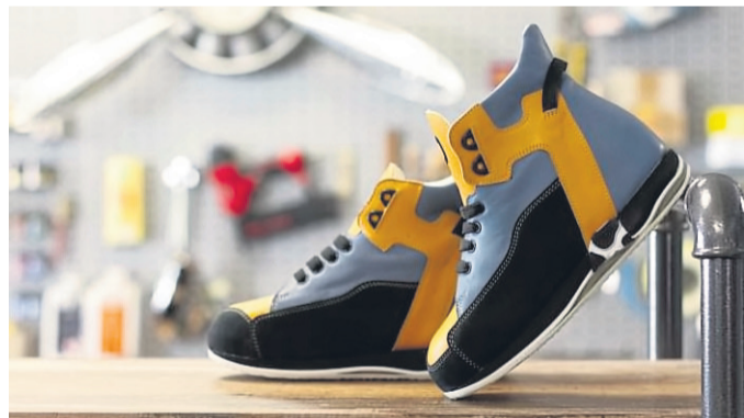
Ana Anastasiadou und ihr Footopia-Team lindern Fußschmerzen unter anderem mit orthopädischen Maßschuhen.

Footopia Brüder-Grimm-Straße 7 Steinau ☎ (06663) 4749824 footopia.de