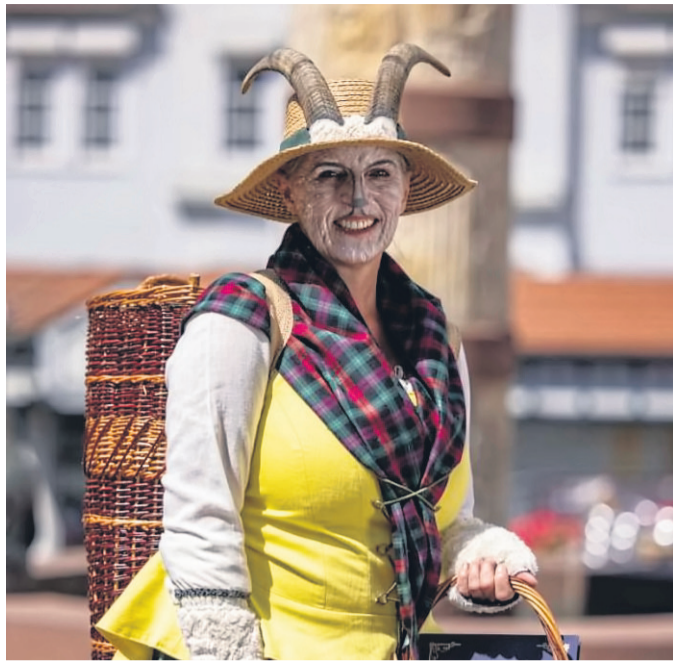
Mutter Geiß aus „Der Wolf und die sieben jungen Geißlein“ lässt die Kinder in ihr Märchen eintauchen.