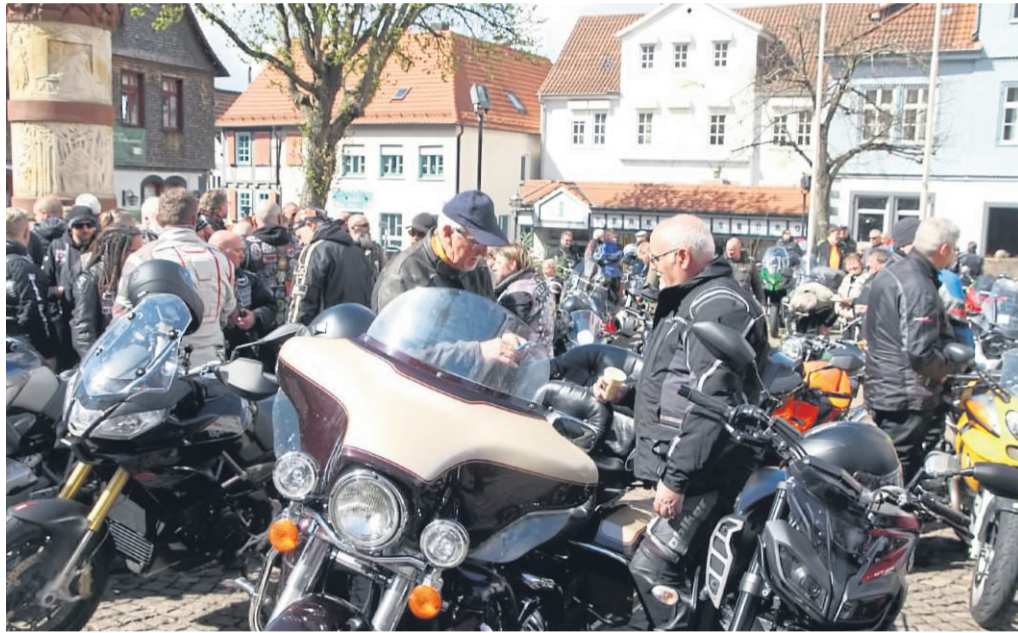
Erste Benzingespräche führten die Biker auf dem Kumpen.