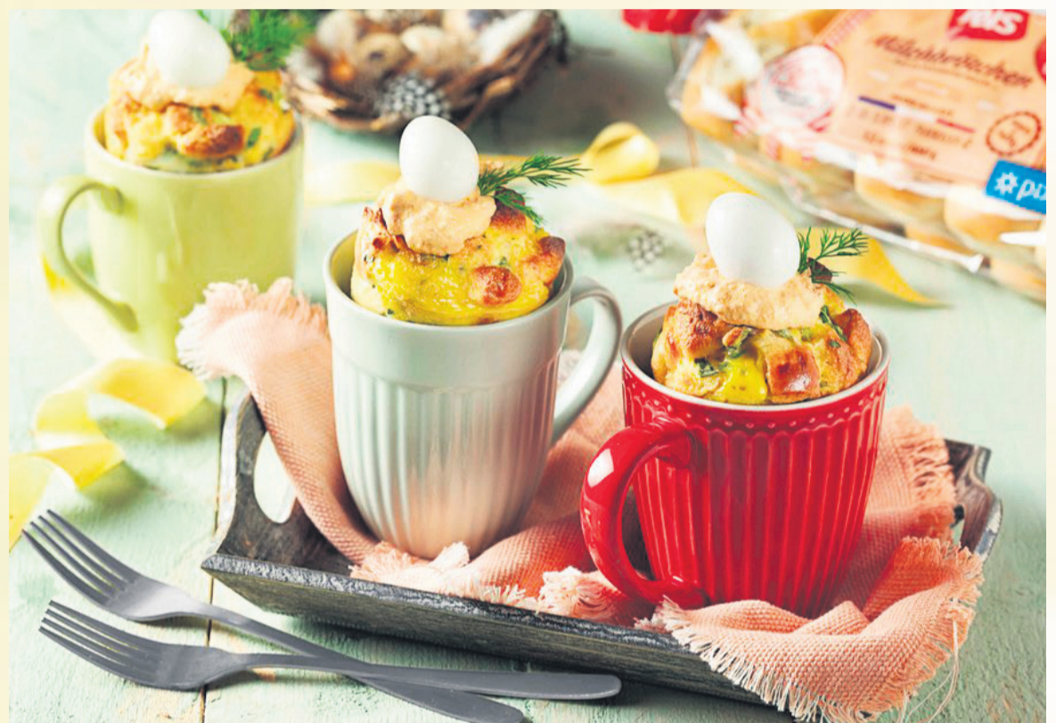
Leckeres für den Osterbrunch: Die pikanten Oster-Mug-Cakes werden mit Wachteleiern dekoriert.

Die IBIS Milchbrötchen in kleine Würfel schneiden und in eine Schüssel legen. Frühlingszwiebeln waschen, in feine Ringe schneiden und mit der klein gehackten Petersilie zu den Brötchen geben. Die Milch mit den Eiern, etwas Salz und Pfeffer verquirlen. Über die Milchbrötchenwürfel gießen und alles etwa 20 Minuten ruhen lassen. 4 Tassen mit Butter einfetten. Schafskäse würfeln und mit dem