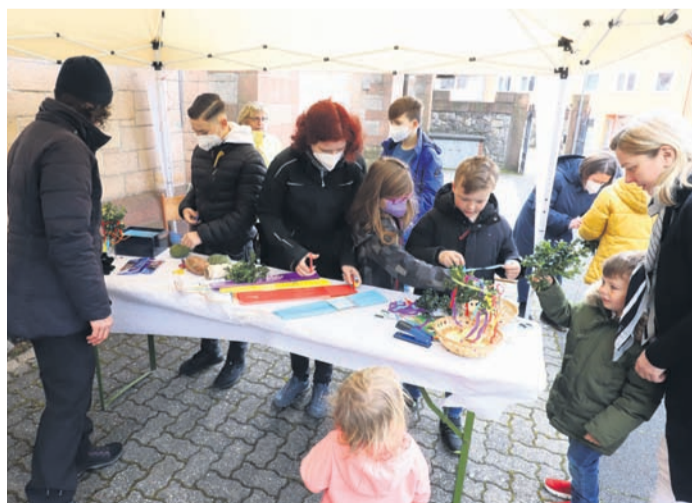
Zum Abschluss des Stationen-Weges banden die Kinder im Kirchgarten mit ihren Eltern kleine Palmsträuße.