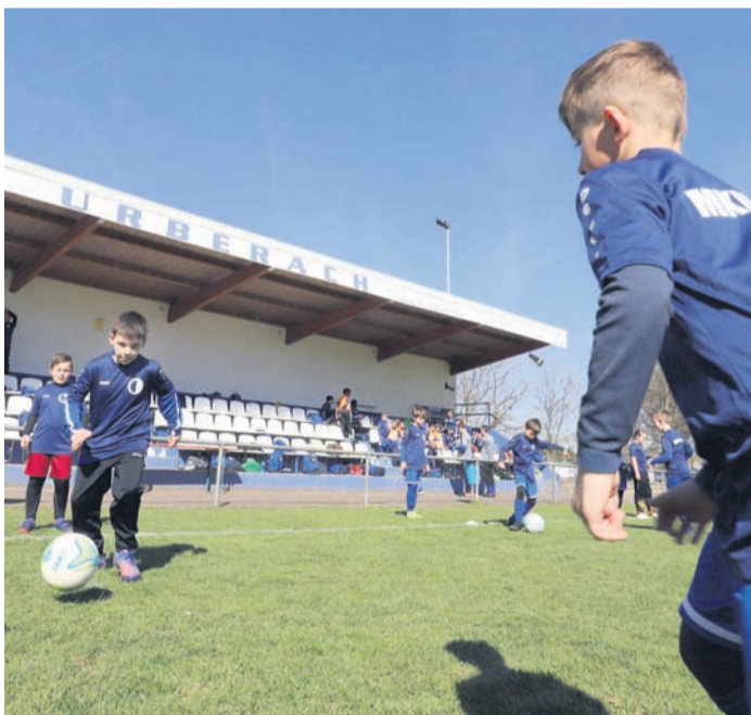
An den vier Camptagen wurde intensiv trainiert.

sich - nachdem alle ihr Camp-Shirt erhalten hatten - mit dem Nachwuchs auf ereignisreiche