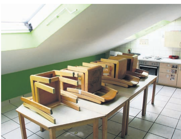
In dieser ehemaligen Abstellkammer essen die Kinder der lila Gruppe. Erwachsene müssen in diesem Raum des Obergeschosses des Kita-Gebäudes den Kopf einziehen. Nicht erst im Hochsommer wird es dort zudem sehr heiß.