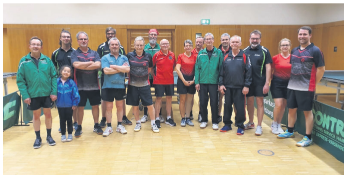
Freundschaftsspiel gegen Richen.