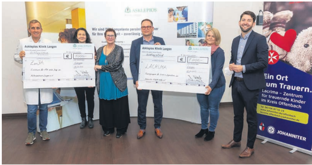
Scheckübergabe an die Vereine.