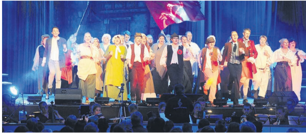
Die Nutzung Münsterer Liegenschaften wie der Kulturhalle (hier bei einem Musical des AGV-Chors „FLAME“) soll für die Ortsvereine künftig kostenlos sein. Ob das auch für Veranstaltungen gelten soll, bei denen die Vereine Eintritt erheben, debattiert demnächst der Haupt- und Finanzausschuss.

Das ist beispielsweise in Eppertshausen schon seit vielen Jahren so - und eine indirekte, aber wertvolle Art der Vereinsförderung. Die Eppertshäuser Bürgerhalle dürfen die örtlichen Vereine (mit Ausnahme einer kleinen Reinigungspauschale) auch dann kostenlos bespielen, wenn sie dort größere Veranstaltungen mit Eintritt (etwa die Fastnachtssitzungen des FVCA) durchführen und dabei größere Beträge