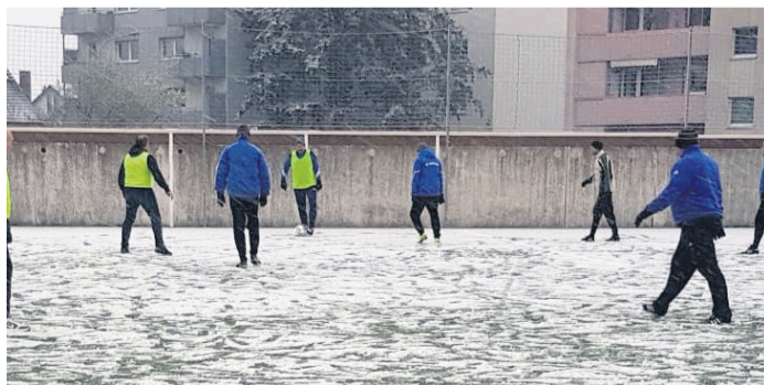
Walking Football beim SVM.