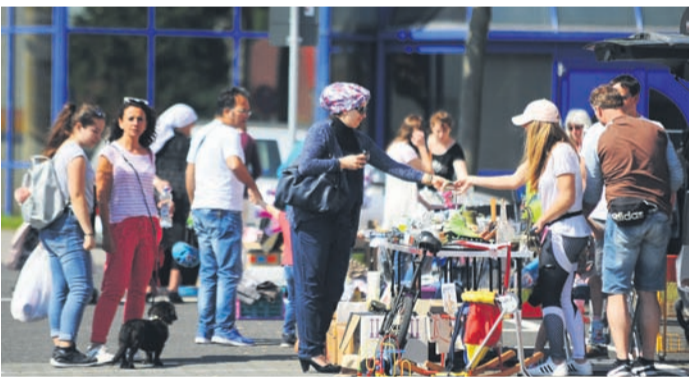
Sogar für die Nutzung des Abtenauer Platzes (hier ein Foto vom Flohmarkt des Vereins Radsport) mussten die Vereine in Münster und Altheim bislang Gebühren an die Gemeinde entrichten. Dies soll nach dem Willen der CDU dauerhaft entfallen.

das Rathaus-Foyer sowie die Mehrzweckräume im Storchenschulhaus, im Alheimer Gustav-Schoeltzke-Haus und in der Seniorenwohnanlage Walterstraße. Kostenlos soll es für die Münsterer und Alheimer Vereine künftig auch sein, die beiden Freizeitzentren, den Rathaus-Platz und den Abtenauer Platz für die eigenen Aktivitäten zu mieten. Beschlossen wurde der CDU-Antrag vergangenen Woche indes noch nicht, wurde stattdessen einstimmig zur weiteren Beratung in den Haupt- und Finanzausschuss überwiesen. Dort soll insbesondere die Frage debattiert werden, ob die Gemeinde Münster womöglich zumindest dann weiter Gebühren von „ihren“ Vereinen erheben soll, wenn diese bei Veranstaltungen Eintrittsgeld erheben. Auch der Spezialfall „ARThaus“ könnte in diesem Zug mal wieder zur Sprache kommen. Hier nutzt der gleichnamige Verein das ehemalige Alheimer Rathaus (das auch unter seiner neuen Zweckbestimmung weiter der Gemeinde gehört) fest für seine Arbeit.