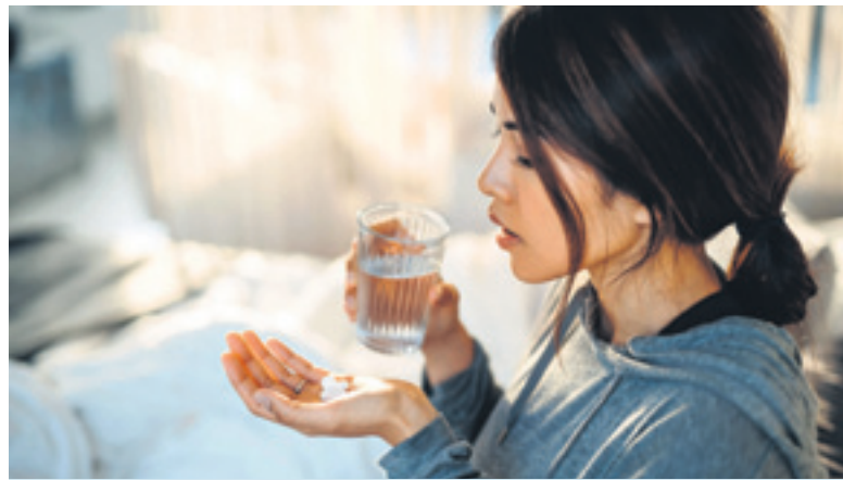
Welcher Wirkstoff den Schmerz am besten bekämpft, ist individuell unterschiedlich.

Deshalb ist es gut, dass es nicht nur einen verfügbaren Schmerzmittelwirkstoff gibt, sondern mehrere. Doch welchen man auch immer wählt: Durch den Zusatz von Koffein lässt sich der Effekt noch steigern. Hier haben sich zum Beispiel Kombinationen aus ASS, Paracetamol und Koffein wie in Thomapyrin Classic und Intensiv oder aus Ibuprofen und Koffein in Thomapyrin Tension Duo bewährt. Koffein kann die Schmerzhemmung im zentralen Nervensystem verstärken, indem es an speziellen Rezeptoren andockt, die für die Steuerung von Erregungsprozessen zuständig sind. Wer sich außerdem ein bisschen Ruhe gönnt fühlt sich in der Regel schnell besser. Bei Spannungskopfwie hilft aber oft auch Bewegung.