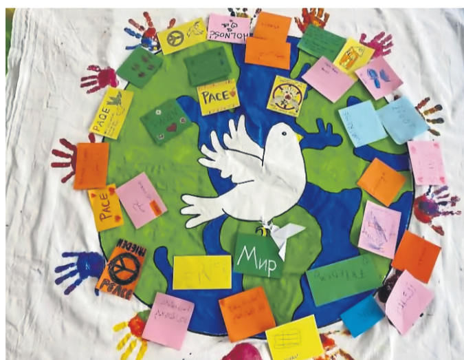
Die Kinder malten und schrieben mit ihren Eltern in ihrer jeweiligen Muttersprache bunte Kärtchen mit Friedensbotschaften.