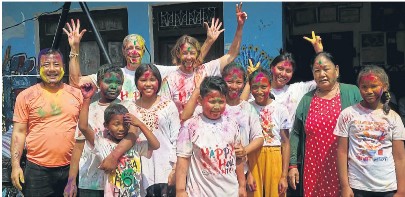
Beim farbenfrohen Holi-Frühlingsfest wurde ausgelassen mit den Kindern der beiden Waisenhäuser in Sauraha und Bharatpur gefeiert.

Schon die Organisation des Gepäcks war eine logistische Herausforderung. Während ein halb gefüllter Koffer in der Holy Lodge im Touristenviertel Thamel in Kathmandu deponiert war, wurde ein weiterer Koffer in einem Reisebus zum nächsten Zielort Sauraha mitgegeben, um dort von Hotelbediensteten