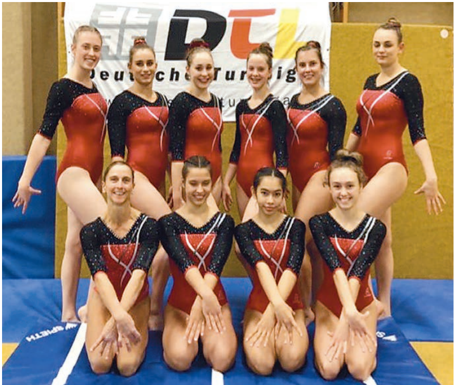
Rang 4 in der Regionalliga 2021 für die TG Main-Rhein

Bei den zwei darauffolgenden Wettkampfrunden im November präsentieren sich die Damen zwar weiterhin souverän, mussten am ein oder anderen Gerät allerdings Stürze und kleinere Unsauberkeiten in Kauf nehmen. Daraus ergab sich jeweils Rang 4 an den beiden Wettkampftagen und ebenfalls ein 4. Platz in der Gesamtwertung nach der dritten Wettkampfrunde. Mit diesem Ergebnis verpasste die TG Main-Rhein zwar knapp einen Podestplatz, sicherte sich jedoch das Recht, auch in 2022 wieder in der Regionalliga Nord starten zu dürfen. Unter den durch die Pandemie erschwerten Trainingsbedingungen können unsere Mädels mit diesem Resultat mehr als zufrieden sein. Wir freuen uns darauf, auch in diesem Jahr wieder in der Regionalliga anzugreifen und hoffen natürlich, 2022 auch noch viele weitere Wettkämpfe bestreiten zu dürfen.