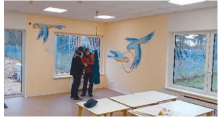
Im Innenbereich: Wunderschöne Motive zieren die Wände

auch mit den großen Verpackungskartons, die noch täglich mit nachgelieferten Möbeln und Materialien ankommen, kann man super im Flur spielen und sich verstecken.