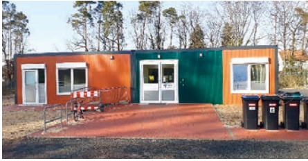
Der Vorplatz vor dem Eingang konnte noch rechtzeitig vor dem Winter fertiggestellt werden