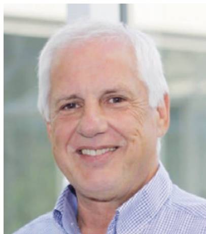
Hubertus Riedl Partnerschaftsverein

Ich bin dankbar, dass ich mehr als 75 Jahre Frieden in Freiheit erleben konnte. Dass ich nicht wie mein Vater in den Krieg ziehen musste, um auf andere Menschen zu schießen und wie mein Vater dabei selbst umzukommen. Angesichts von Krieg und globalen Problemen beschleicht mich Angst um die Erhaltung des Friedens in Zukunft.