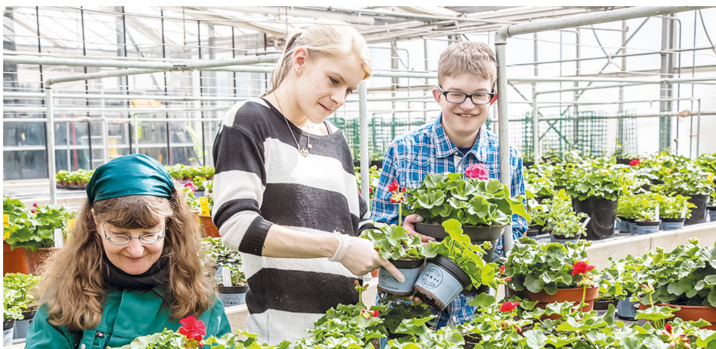
Die Mitarbeitenden freuen sich schon auf den ersten Blumenbasar nach zwei Jahren Pause.

Gottesdienst, Grundsteinlegung Tagesförderstätte, Blumenverkauf und Begegnung von 10 bis 17 Uhr