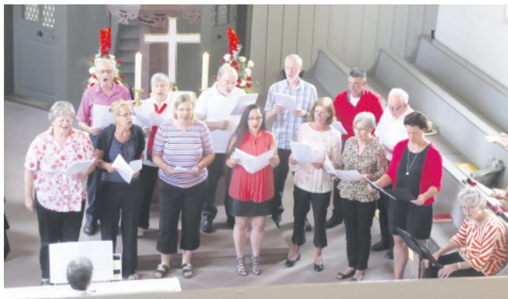
Der Projektchor am Kerbsontag, 25. August 2019, Evangelische Kirche Wixhausen.