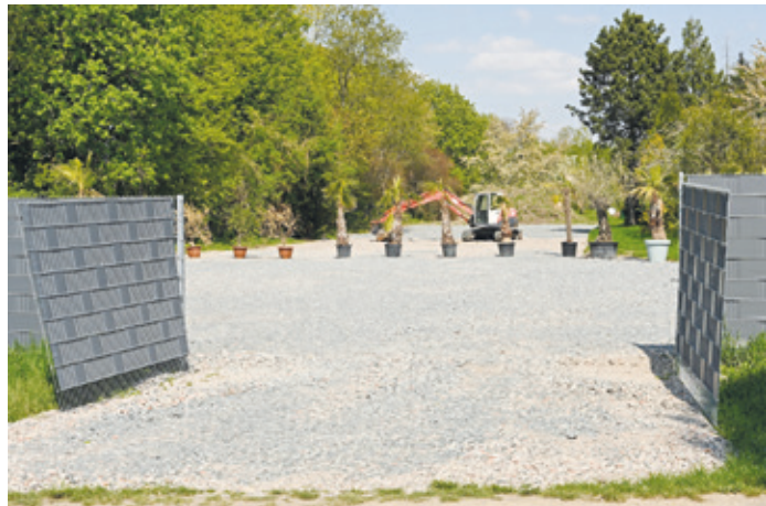
Eine dicke Schotterdecke mit Bagger auf dem ehemaligen Gehölz und Wiesengelände in der Gärtnerei „Maulbeergarten“, vergeblich kaschiert durch eine Reihe vertrocknender Kübelpalmen.

(Arheilgen, PK) Im Grünzug am Ostrand von Arheilgen hatte Gärtner Gangnus über viele Jahre an der Maulbeerallee eine große Gärtnerei betrieben. Die aktuelle Pächterin formte daraus in den letzten Jahren den „Maulbeergarten“. Jüngst wechselte das Eigentum an diesem Gelände an einen Bauunternehmer. Seit Februar wandelt der das Gelände brachial um: Auf gut 3000 m 2 hat er auf dem Pachtgelände die Gehölze gerodet, den Wiesenoberboden abgeschoben und eine mächtige Schotterdecke aufgebracht. Eins der drei Gewächshäuser wurde zu einem Baustofflager zweckentfremdet, Baumaschinen warten auf weitere Einsätze. Zwei Einfahrten wurden geschaffen, um dort zunächst ein Drive-In-Corona-Testzentrum einzurichten. All dies ist illegal. Der Darmstädter Flächennutzungsplan lässt in diesem Grünzug nur den Betrieb einer Gärtnerei zu. Deshalb haben sich mehrere Bürger an die Stadt Darmstadt mit der Aufforderung gewandt, diesen gravierenden Eingriff in Natur und Landschaft rückgängig zu machen. Die Stadt bleibt jedoch wortkarg. Das Umweltamt verweist auf das Bauaufsichtsamt und das Bauaufsichtsamt äußert sich nur abweisend: „Aus datenschutzrechtlichen Gründen können wir Ihnen leider keine