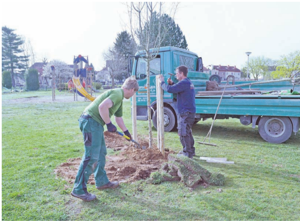
Zwei „Echte Rotdornen“ spendete eine Münsterer Familie im Namen ihrer beiden Kinder für Münsters Bürgerpark.

So erläutert es Rischer. Damit nutzen die zwei „Neuen“ auch der heimischen Fauna in unserer Klimaschutzkommune. Zudem sei diese Art sehr trockenresistent und trägt farbenprächtige Blüten, erklärt der spendende Familienvater. Knospen sind jedenfalls an den 6-8 Jahre vorgezogenen Bäumchen schon reichlich vorhanden. Die Namen beider Kinder stehen auf beiden Baumschildern, sodass im Fall des Sterbens eines Baums kein Kind enttäuscht ist. Achten wollen sie aber beide auf ihre beiden Bäume und von Zeit zu Zeit nach dem Rechten sehen. Bürgermeister Schledt bedankt sich: „Eine tolle Aktion, von der alle im Bürgerpark profitieren. Bäume sind nicht nur gut fürs Klima, sondern verschönern auch unser Ortsbild.“