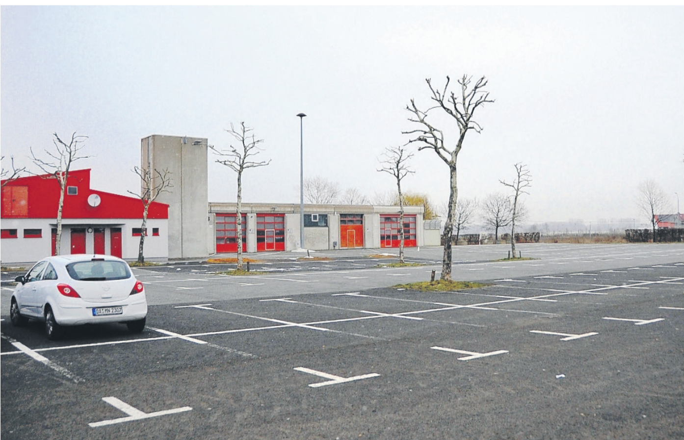
Der Abtenauer Platz, gelegen direkt neben dem Feuerwehr-Stützpunkt (hinten), wird vom 8. bis 11. Juli Standort fürs Festzelt und den Vergnügungspark sein.