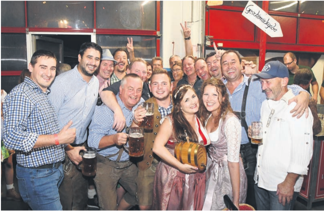
Zum Abschluss des Jubiläumsjahrs wird am 1. und 2. Oktober auch das Oktoberfest der Münsterer Feuerwehr sein Comeback in der Fahrzeughalle feiern. (Fotos: jedö)

Den Weg dahin skizziert Sühl so: „Wir haben uns schon 2019 entschieden, dass wir das Fest feiern wollen. Dann kam Corona und die Welt sah anders aus. Wir haben mit den Planungen dennoch weitergemacht, wären ohne Corona aber schon früher an die Öffentlichkeit gegangen.“ Dass man erst jetzt Details zu den Vorhaben der nächsten Monate nenne, liege darin begründet, „dass ja selbst im Winter noch keiner sagen konnte, wie es in diesem Jahr weitergeht“. Nun sei es „an der Zeit gewesen zu entscheiden, ob wir unser Jubiläumsprogramm voll durchziehen oder unter einem gewissen Verlust absagen“.