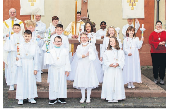
In drei Gruppen empfangen die Münsterer Erstkommunikanten von St. Michael am letzten Wochenende das erste Abendmahl.