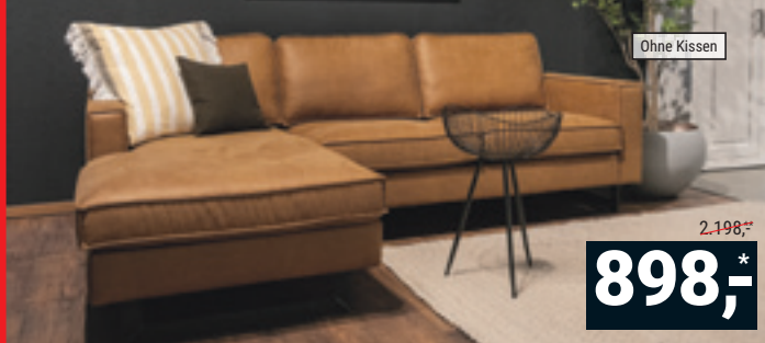
POLSTERECKE , Bezug braun | schwarze Metallkufe | Maße ca. 238x85x170 cm | Art.Nr. 470602-07