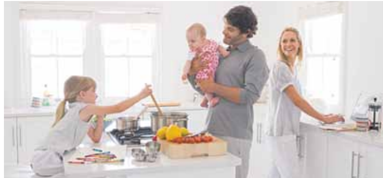
Familienzeit tut Eltern und Kindern gut

(DJD-K). Familienleben mit Baby und Kleinkind: Macht das Eltern stärker oder ist es eher stressig? Dazu befragte im Rahmen des jüngsten Sanofi Gesundheitstrends das Meinungsforschungsinstitut NielsenIQ rund 1.000 Menschen in Deutschland. Die Antworten fallen differenziert aus: So meinen drei Viertel der Befragten, dass sie aus einer solche Familiensituation Kraft schöpfen würden, neun von zehn sagen, dass ein ausgeglichenes Familienleben das gesundheitliche Wohlbefinden stärkt. 70 Prozent der Befragten finden aber auch, dass unter Zeitdruck das Zusammenleben mit Kindern in Stress ausarten kann. Großstadtbewohner sind insgesamt negativer eingestellt: Sie schöpfen nicht nur deutlich weniger Kraft aus dem Familienleben, sondern geben auch häufiger als Bewohner anderer Regionen an, dass ihnen der Alltag mit Kindern überhaupt keine Power verleiht.