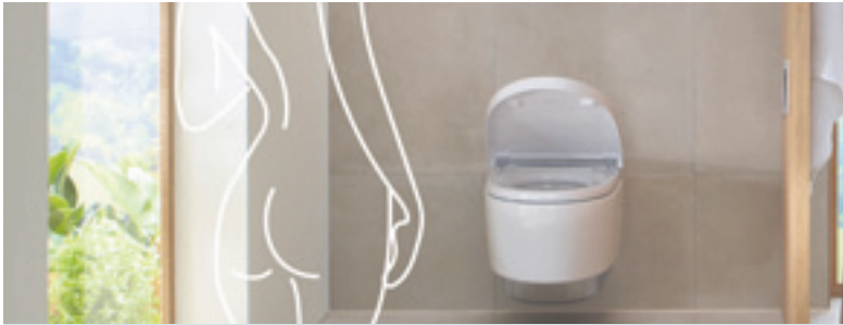
Etwas Training, eine sanfte Zupfmassage und die Reinigung mit reinem Wasser: Viel mehr braucht es nicht, um den Po zu verwöhnen.