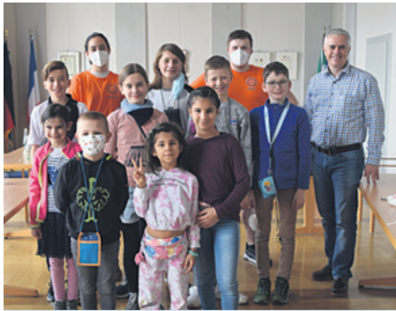
Kinderclubdorf 2022 zu Besuch beim Bürgermeister.

dieses Parkplatzes um Verständnis, dass die Fahrzeuge für diesen Zeitraum auf einen Ausweichplatz umgeparkt werden müssen“, so der Erste Stadtrat abschließend. Das Streetfood-Festival findet vom 6. bis 8. Mai 2022 statt, der Aufbau beginnt bereits am Nachmittag des 5. Mai 2022.