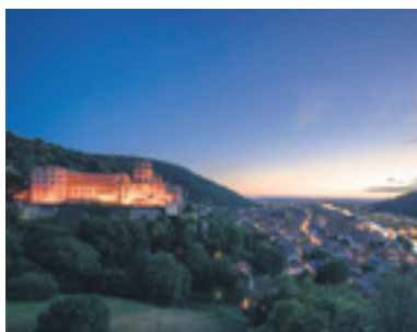
Blick auf das beleuchtete Schloss Heidelberg und die Altstadt bei Nacht.

Heidelberg liegt inmitten der Oberrheinischen Tiefebene und wird von den beiden Bergen Königsstuhl und Gaisberg umgrenzt. Das Stadtbild selbst wird u. a. durch den Neckar geprägt. Der Fluss trennt Heidelberg in zwei Hälften, wobei sich der Großteil der Stadt am linken Ufer des Neckars befindet.