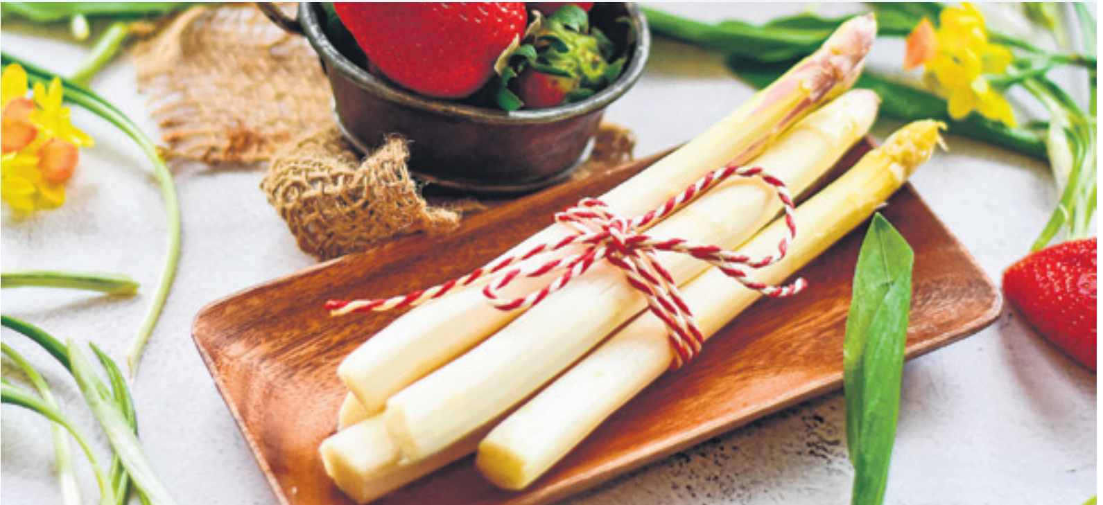
Das leckere Gemüse schmeckt in den verschiedensten Variationen.