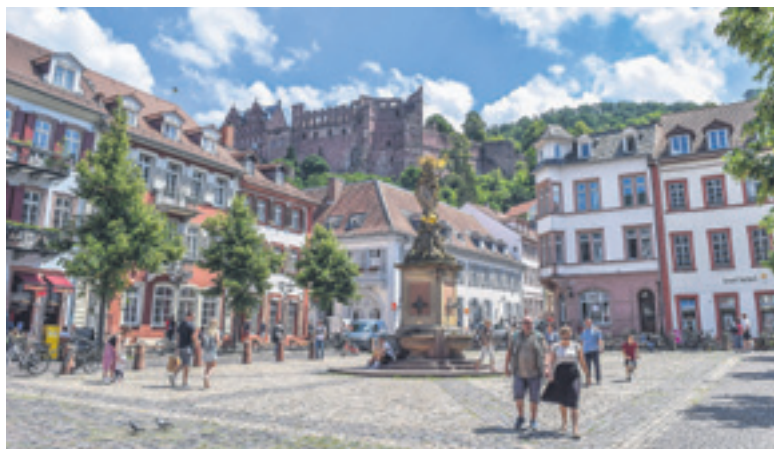
Die Innenstadt von Heidelberg besticht durch kurze Wege und viele historische Gebäude.

größten Stadtentwicklungsprojekte in Deutschland. Inmitten der romantischen Stadt, direkt am Neckar entstehen aktuell Wohnungen und Arbeitsplätze für mehr als 10000 Menschen. Der Mix aus Wohnen, Wissenschaft und Wirtschaft führt auch hier die Tradition der Stadt Heidelberg fort. Trotzdem schafft man mit einem einzigartigen Energiekonzept die perfekte Brücke in die Zukunft. Passivhausstandard in sämtlichen Gebäuden und ein ausgeklügeltes Mobilitätskonzept sind nur einige der vielen Highlights, besonders was die Umweltperspektive des Stadtteils angeht. Damit ist die Bahnstadt nicht nur für Touristen einen Besuch wert, sondern gilt mittlerweile auch international als Vorbild für viele Stadtentwicklungsprojekte.