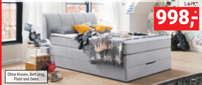
BOXSPRINGBETT , Bezugsstoff hellgrau | Inklusive Topper und großem Bettkasten | Wendematratze Taschenfederkern in H2/H3 | Liegefläche ca. 140x200 cm | Art.Nr. 470093-06