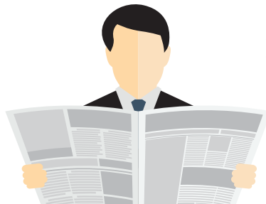
Designed by freepik

Trapezbleche 1. Wahl + Sonderposten aus eigener Produktion, TOP-Preise, cm-genau, 98646 Eishausen, Straße in der Neustadt 107, bundesweite Lieferung! ☎ 03685 - 409140, 5% Online-Rabatt sicher. www.dachbleche24.de