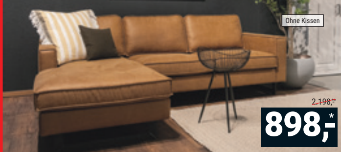
POLSTERECKE , Bezug braun | schwarze Metallkufe | Maße ca. 238x85x170 cm | Art.Nr. 470602-07