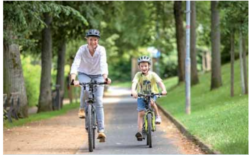
Radfahren macht Spaß.