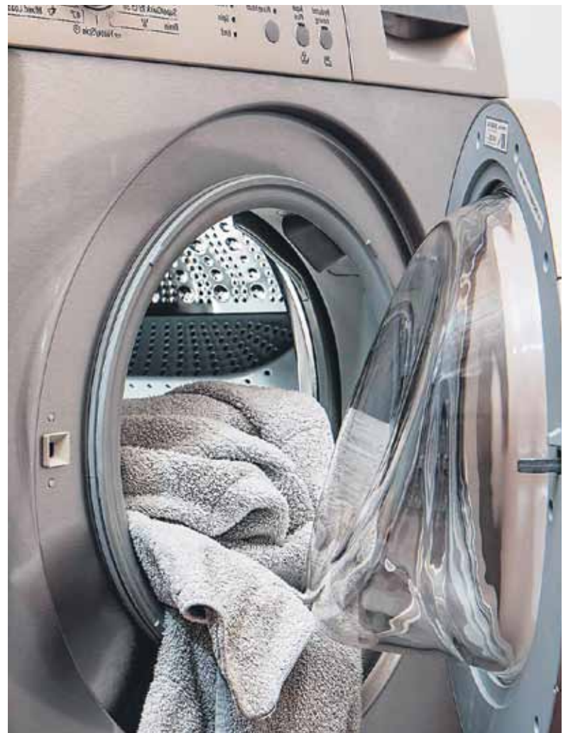
Nach der Fleckenbehandlung – ab in die Waschmaschine. So sieht die Kleidung hinterher wieder aus wie neu.

Wenn es wieder wärmer wird, schwitzen wir mehr. Schweißflecken auf Shirts und Hemden lassen sich gut mit Essig auswaschen. Bei Seide können Flecken mit Spiritus ausgerieben werden. Wer auf Nummer sicher gehen will, gibt seine Fleckenwäsche in die Reinigung.