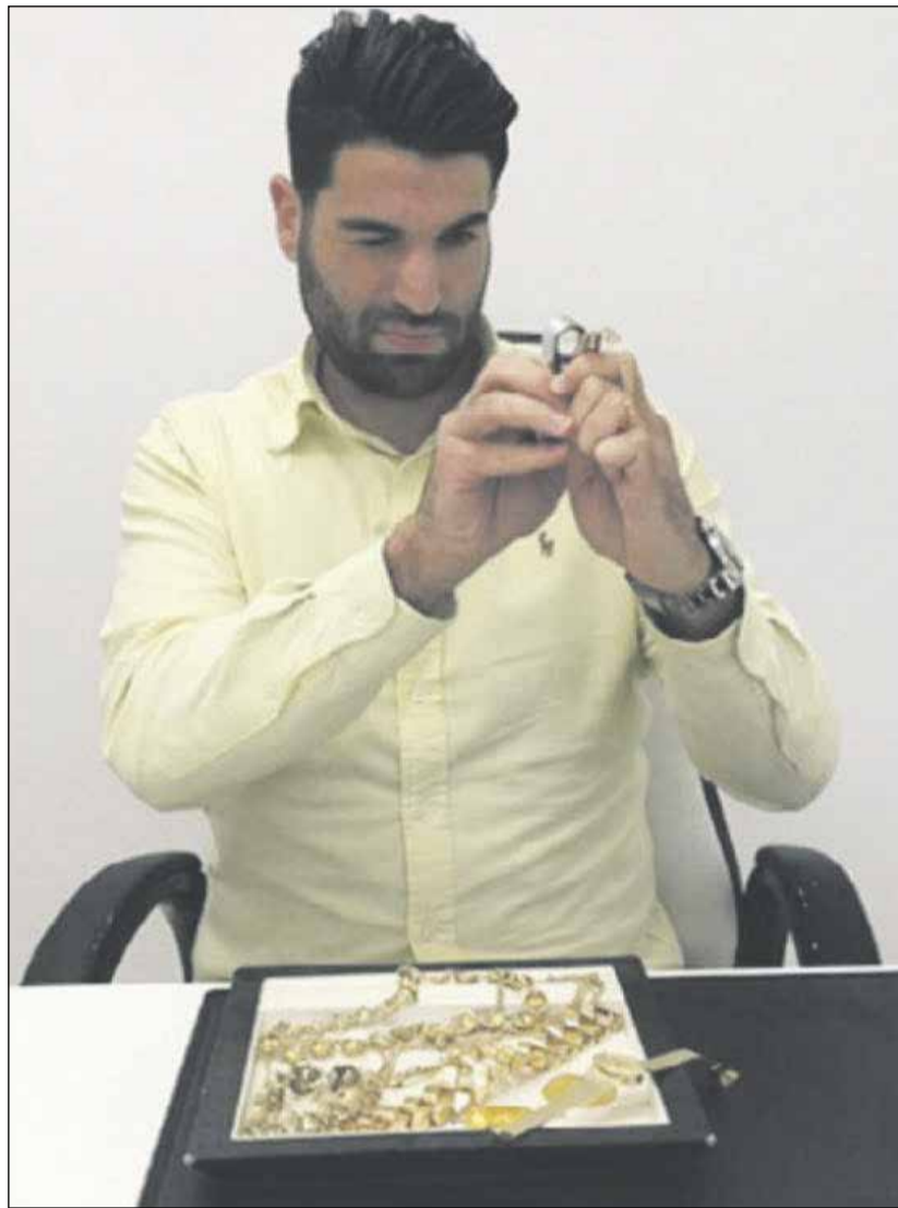
Ihr Spezialist für Goldankauf.