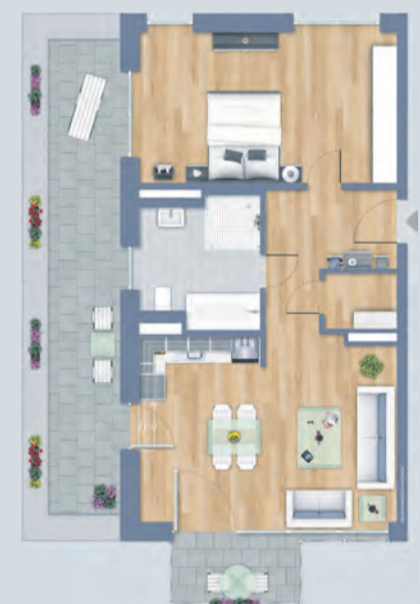
Abb.: Grundriss Wohnung-Nr. A9, 2 Zimmer, 2. OG, Wohnfläche 74,19 m 2