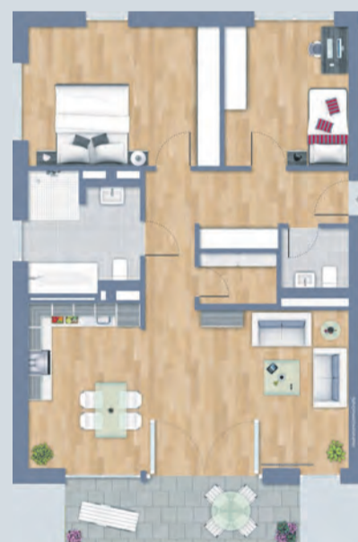
Abb.: Grundriss Wohnung-Nr. A1, 3 Zimmer, EG, Wohnfläche 91,66 m 2