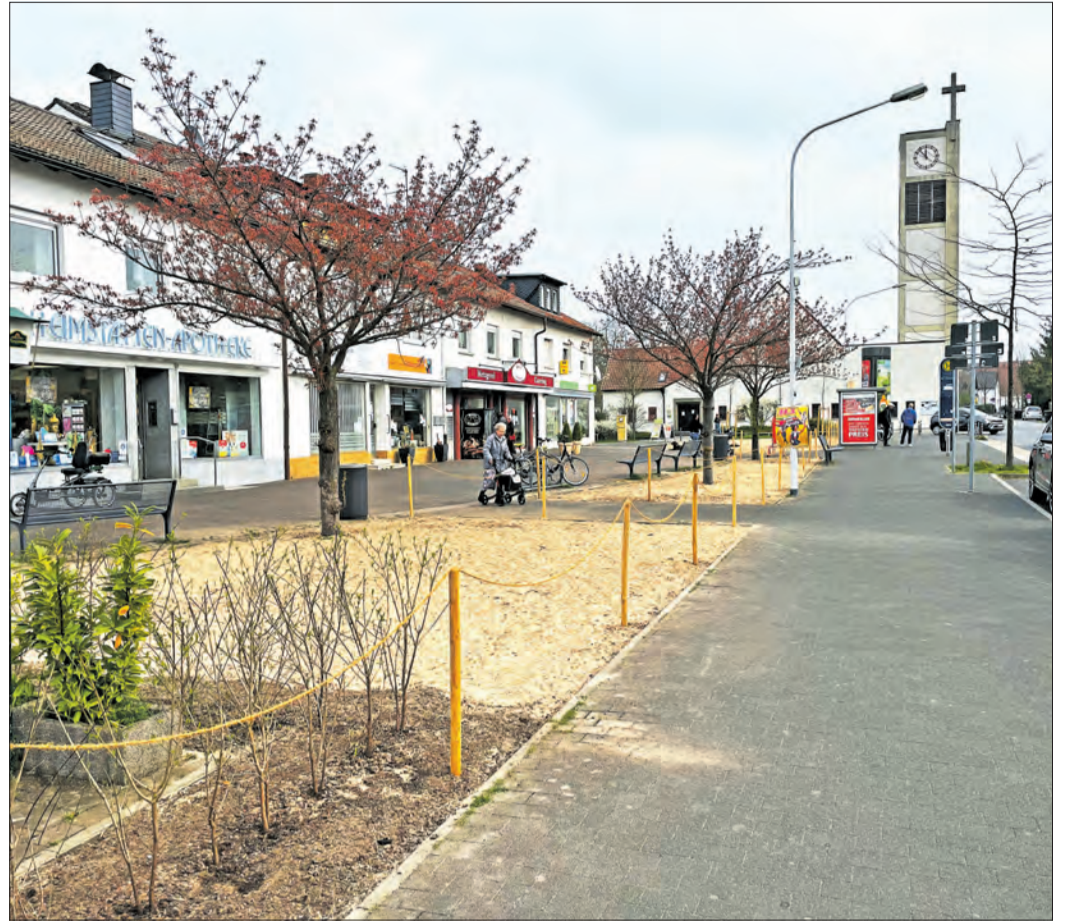
SCHÖN GEWORDEN ist der Straubplatz in der Heimstättensiedlung nach seiner Umgestaltung.

in Darmstadt an Unterkünfte für geflüchtete Kinder und Jugendliche. In dieser Zeit wurde das FREUND-SCHAFTSMOBIL aufgebaut. Diese Arbeit war wichtig, sehr erfolgreich und hat uns viel Spaß gemacht. Nun werden wir wieder gebraucht und versuchen sehr schnell zu reagieren.“ Bislang werden die Einsätze des Spielmobils gemeinsam mit dem Jugendamt der Wissenschaftsstadt Darmstadt ermöglicht und mit dem DRK als Träger abgestimmt. Wir wissen aber jetzt schon, dass weitere Standorte dazukommen werden. Entsprechende Hallen und Unterkünfte hat die Stadt bereits vorbereitet. Deshalb wollen auch wir schnell unsere Kapazitäten ausbauen. Wir freuen uns daher, wenn uns Firmen und Privatpersonen mit einer Spende unterstützen wollen. Neben einer normalen Überweisung geht das jetzt auch über Paypal. (ng)