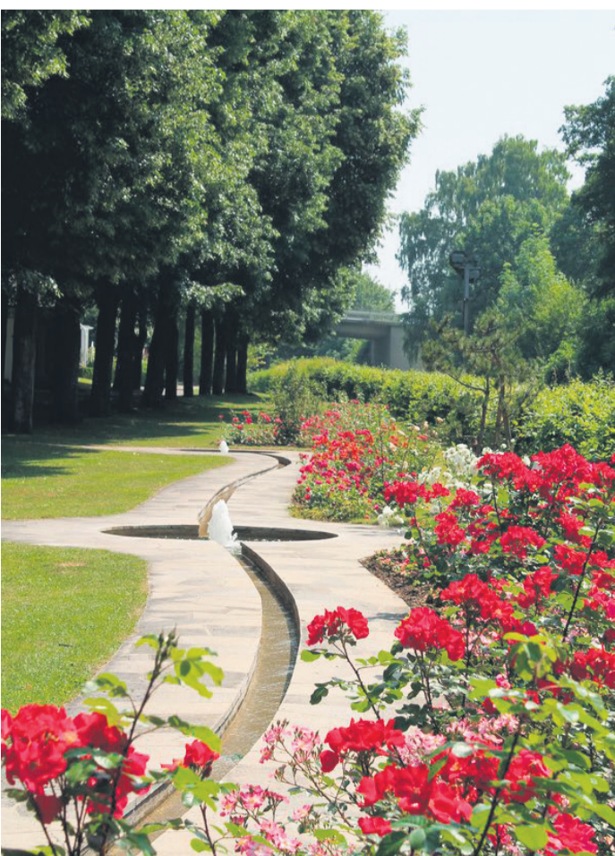
Wirkt beruhigend: Der sogenannte Rosenbachlauf im farbenprächtigen Kurpark von Bad Mergentheim.