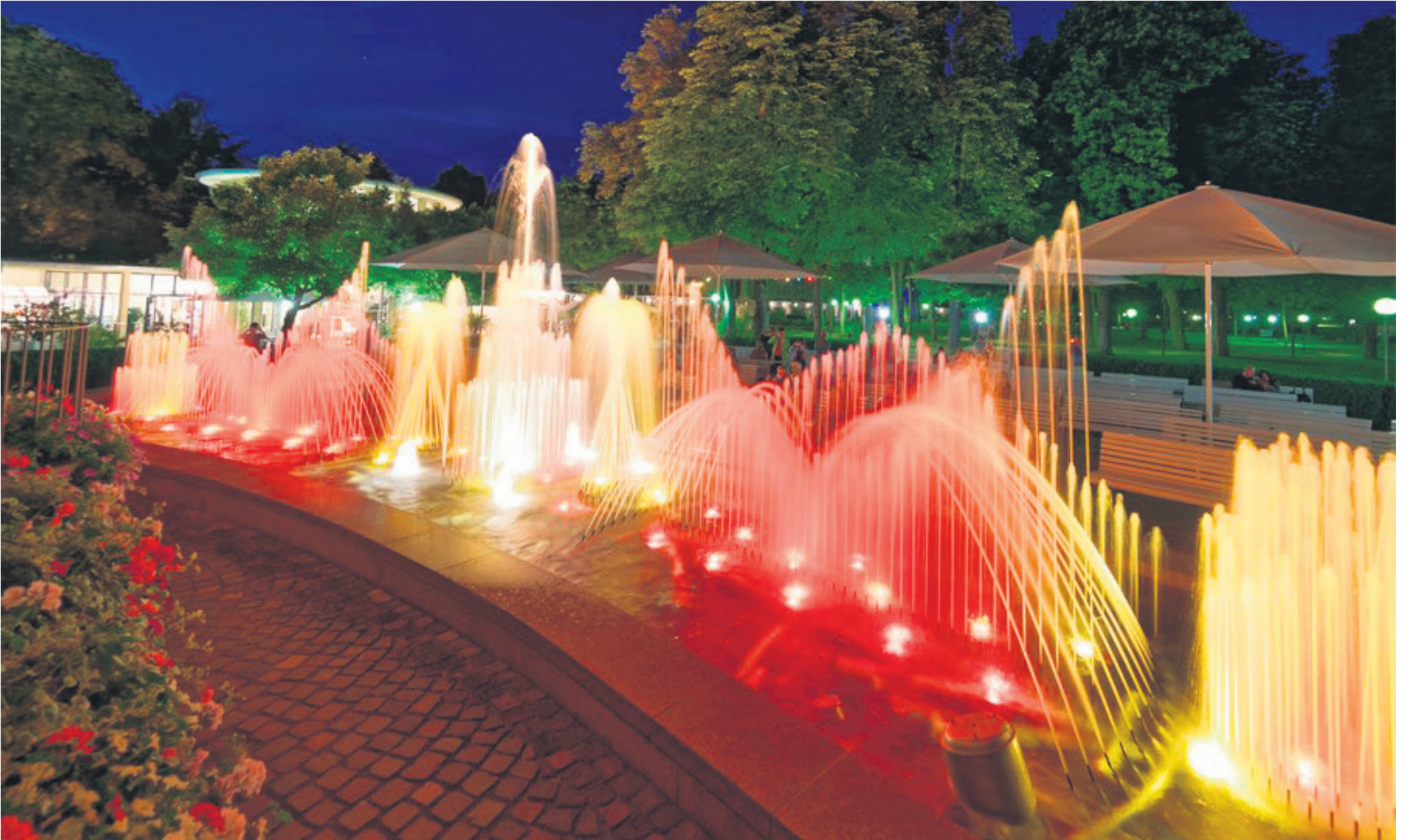
Gut für Körper, Seele, Augen und Ohren: Die Wasserspiele im Bad Mergentheimer Kurpark sind ein Hingucker.