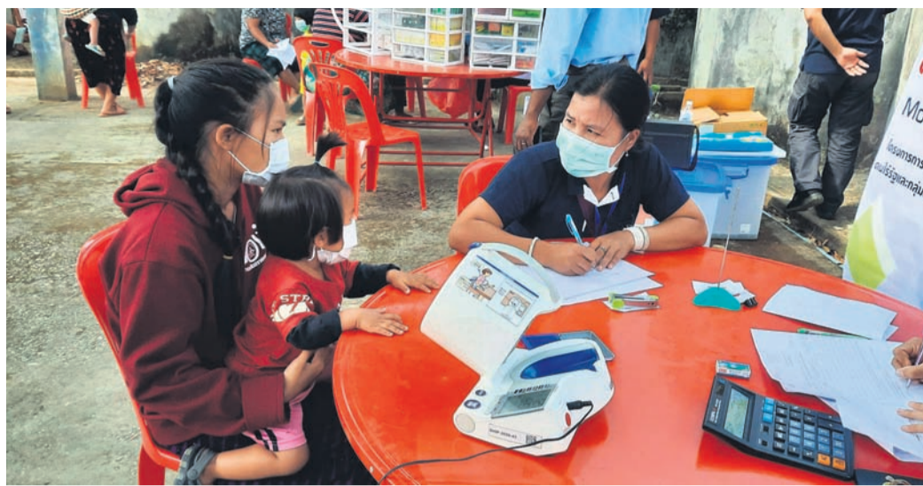
Eine Mutter und ihr Kind besuchen die mobile Klinik des Projektes

Region (NZO) Menschenhandel und Zwangsarbeit sind in Thailand nach wie vor weit verbreitet. Die Not und die Verzweiflung armer Familien werden dabei besonders ausgenutzt. Mit dem falschen Versprechen einer Verbesserung ihrer Lebenssituation werden vor allem Kinder Opfer von Menschenhändlern. Das von der Else Kröner-Fresenius-Stiftung (EKFS) kofinanzierte Projekt der Stiftung Kinderzukunft bekämpft aktiv die Ursachen von Kinderarbeit und Menschenhandel.