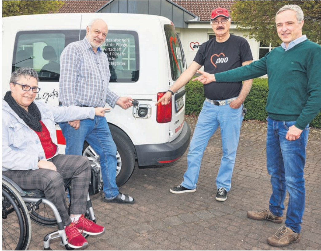
Aufgrund der hohen Spritpreise muss auch beim Fahrdienst der Preis angepasst werden.