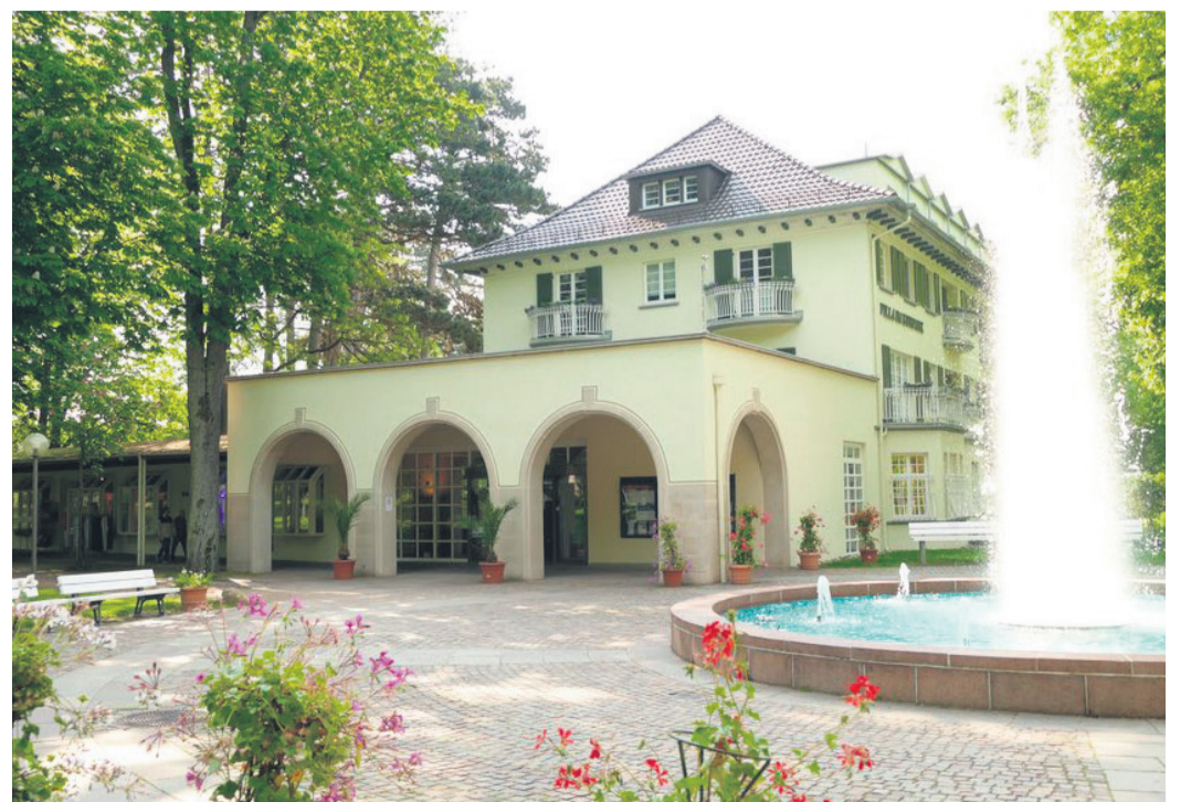
Die Fachleute im Institut für Bad Mergentheimer Kurmedizin, Gesundheitsbildung und medizinische Wellness geben vor allem praktische Anleitungen für eine gesunde Lebensführung.