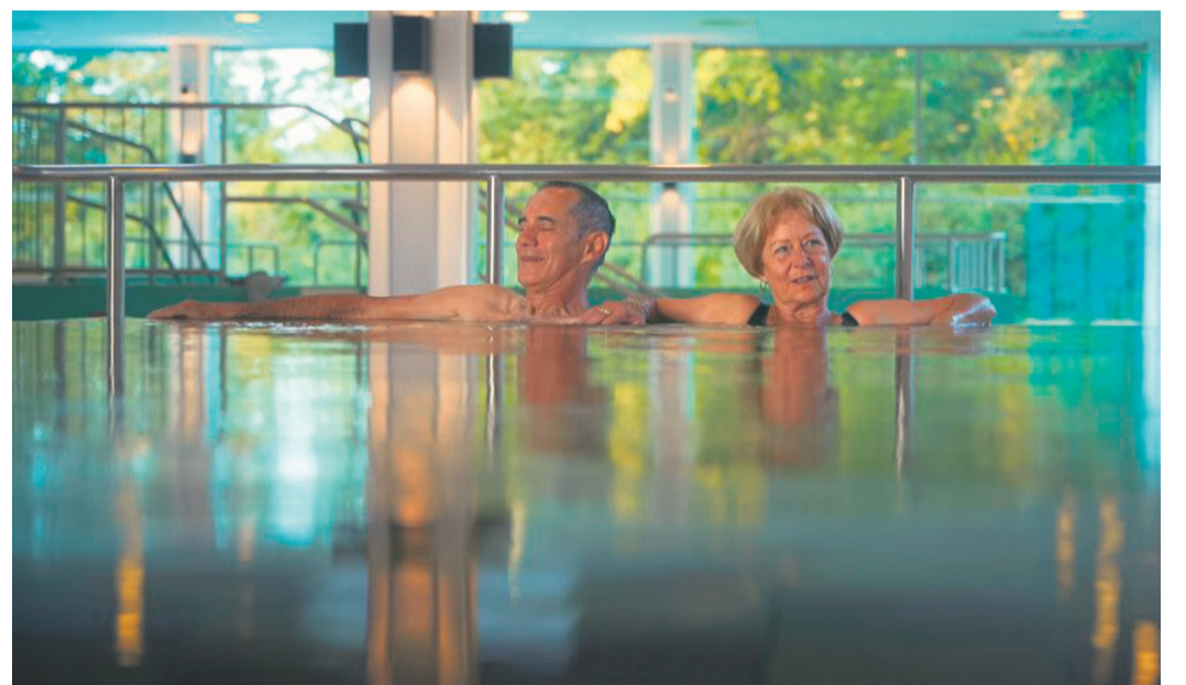
In der Solymar Therme in Bad Mergentheim kann man sich verwöhnen lassen.

Außerdem gibt es Kurse zu Yoga und Meditation, Qigong- und Wirbelsäulengymnastik oder zu Entspannungstechniken, Rücken- und Wirt-