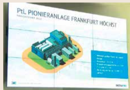
Pilotprojekt im Industriepark Höchst produziert synthetisches Kerosin.

furter Flughafen. Durch synthetisches Kerosin, das im Industriepark Höchst hergestellt wird, soll nun die Energiewende im Luftverkehr herbeigeführt werden. Die Pilotanlage im Industriepark Höchst ist ein Projekt des Unternehmens Ineratec und dem hessischen Kompetenzzentrum für Klima- und Lärmschutz im Luftverkehr. Ab 2026 sollen mindestens 0,6 Prozent der Flugzeuge mit synthetischem Kerosin unterwegs sein. Bis 2030 zwei Prozent.