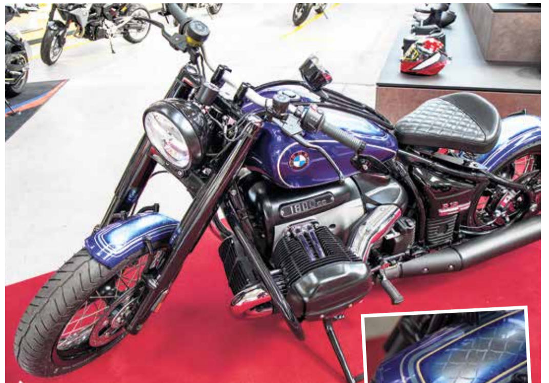
Das Vorführmodell ist sehr speziell. Blau mit dem Motiv des Gerippten

Eine Kaffee- und Getränkebar lädt immer zu einem kurzen Besuchsstopp ein. Gemütliche Ledersofas bieten Komfort für die Kunden, die auf die Werkstattleistung warten können. In der ehemaligen Maschinenhalle sind auch die Artikel der Sicherheitsabteilung jederzeit im Zugriff. Das reicht vom Helm über die Lederkombi bis zur Jeans mit versteckten Sicherheitskomponenten. Zubehör, das das Motorrad noch flotter – optisch wie PS bezogen – macht, gibt es hier auch.