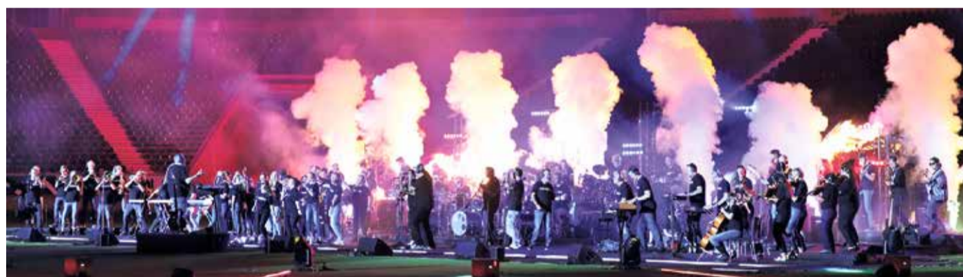
Beeindruckende Showeffekte beim THE GRAND JAM.

Der Keyboarder Jonathan Cain erzählt die Entstehungsgeschichte des Liedes: In den 1970er Jahren verließ er – damals ein aufstrebender Musiker – seine Heimatstadt Chicago in Richtung Los Angeles, in der Hoffnung, seinen großen Durchbruch zu landen. Als die Dinge nicht so liefen wie geplant, rief er seinen Vater um