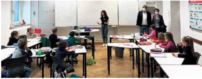
Gemeinschaftliches Lernen fördert die Integration. Ministerialrat Christopher Textor schaute auch in den Klassen vorbei.

Im Austausch mit Ministerialrat Christopher Textor – Neue Kinder erfreuen sich am gemeinsamen Osterfest