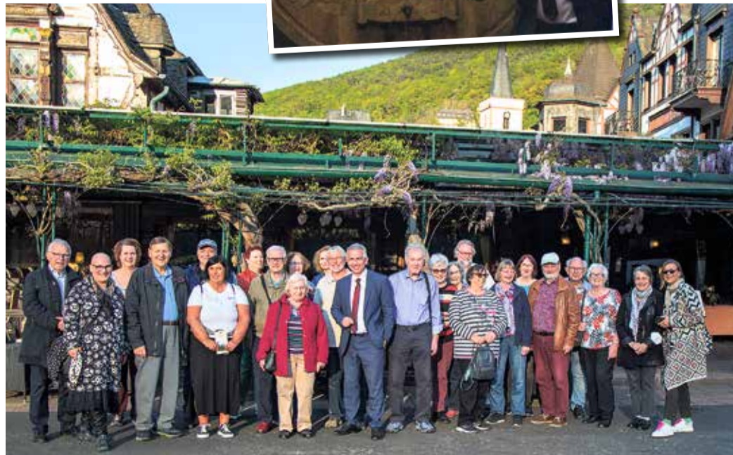
Das ge(be)glückte Abschlussfoto vor dem Hotel Krone in Assmannshausen.