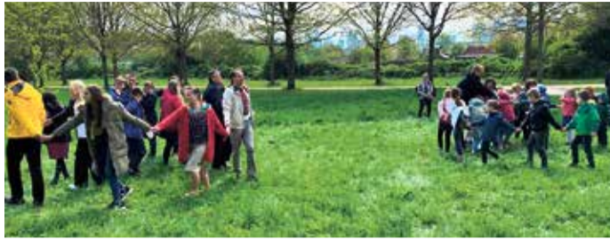
Bewegung und Frühlingslieder erfreuten die Kinder und ihre Mütter bei schönem Wetter.