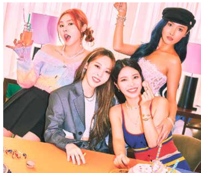
Die Girlgroup Mamamoo – bestehend aus Wheein (von links), Moonbyul, Solar und Hwasa – begeistert K-Pop-Fans an beiden Festivaltagen. Wer für Samstag kein Ticket ergattern konnte, kann sich noch eins spontan für den Livestream sichern.

Tanz-Wettbewerben teilnehmen, Fashionshows genießen, dazu gibt es typische Merchandising-Artikel und Souvenirs, Bühnenprogramm und Streetfood-Stände mit original asiatischer, koreanischer und internationaler Küche. Die Konzerte und Shows im Deutsche Bank Park starten am Samstag um 18 Uhr und am Sonntag um 13 Uhr.