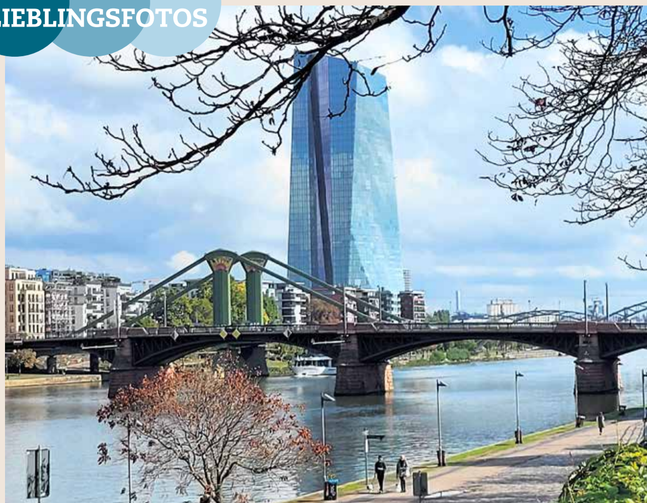
Dieses schöne Foto der EZB hat uns Petra Bickermann aus Hedderheim zugesendet. Vielen Dank dafür!