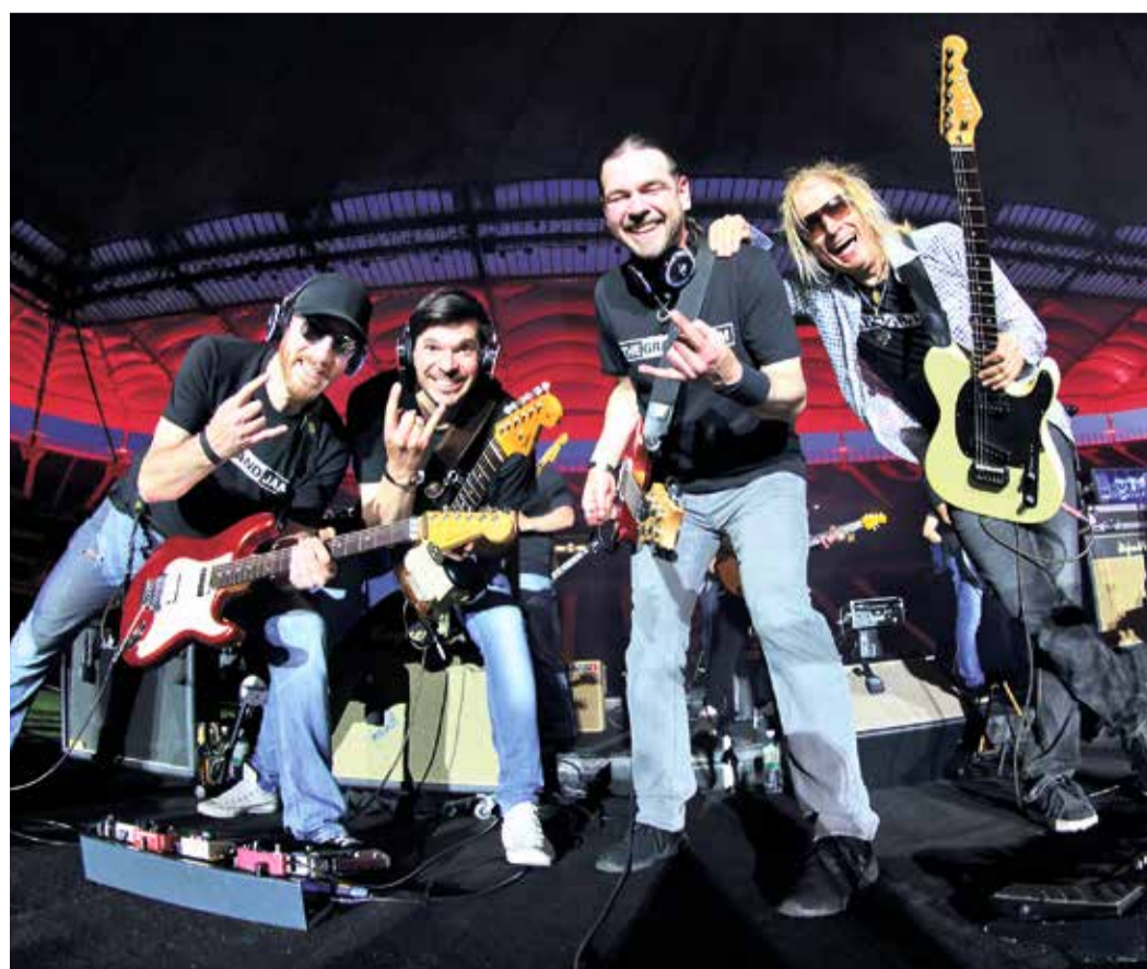
Lassen Sie sich von den Musikerinnen aus der Region verzaubern.

schichte. Den Traum von „Don't stop believin'“ erfüllen sich am 25. Juni 2022 auch viele Musiker/innen aus der Region, wenn sie bei THE GRAND JAM ein Stadionkonzert geben dürfen. Der Deutsche Bank Park wird zur großen Bühne für diesen Song und viele weitere Welthits. Rund 1000 Musiker/innen werden das Stadion rocken und die Tribünen zum Mitsingen bringen. Infos und Tickets zu diesem einmaligen Ereignis finden sich unter: www.thegrandjam.com .