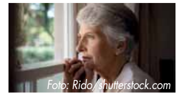
NP-DE-HZX-ADV-R-220017 März 2022

Die Ständige Impfkommission (STIKO) empfiehlt für Menschen ab 60 Jahren sowie für Personen ab 50 Jahren mit Grunderkrankung eine Impfung gegen Gürtelrose. Informieren Sie sich bei Ihrer Ärztin oder Ihrem Arzt, wie Sie sich vor Gürtelrose schützen können.