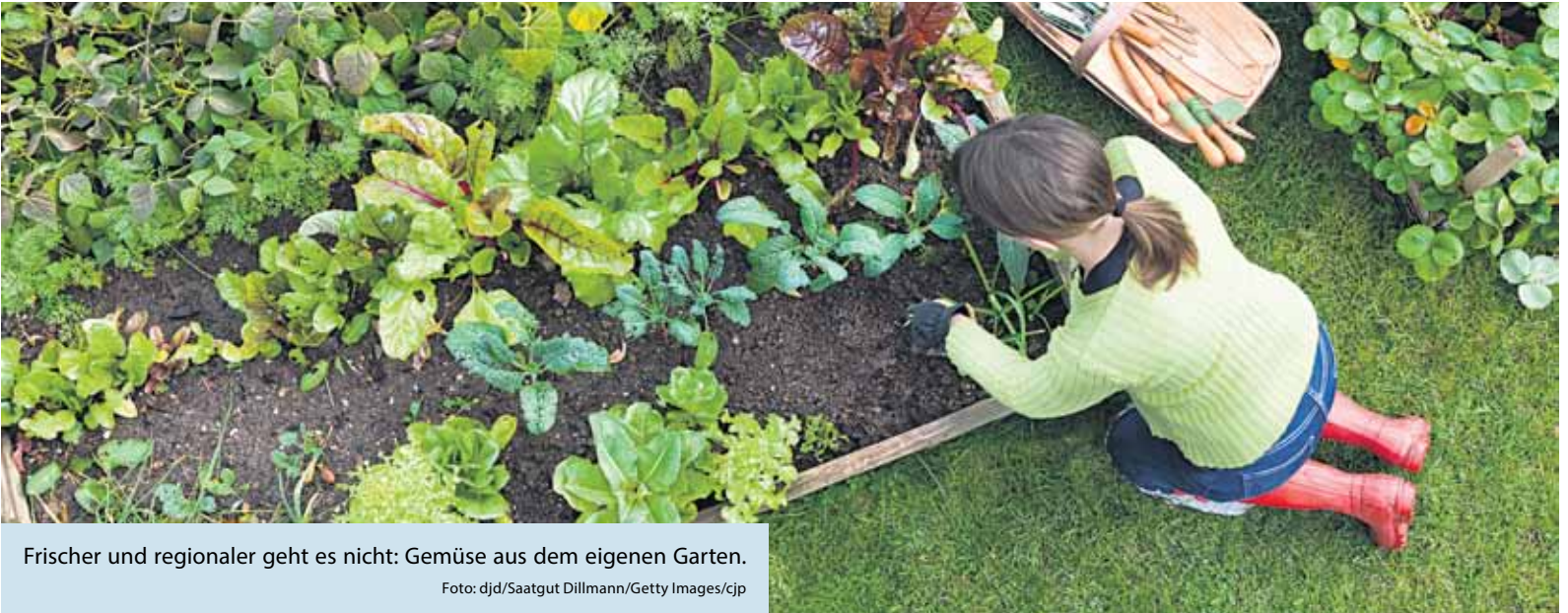
Frischer und regionaler geht es nicht: Gemüse aus dem eigenen Garten.