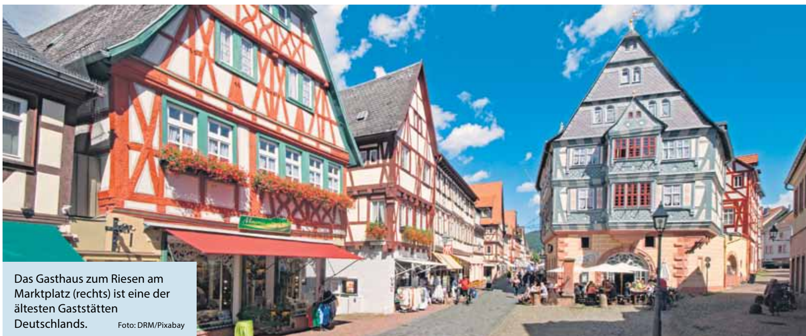
Das Gasthaus zum Riesen am Marktplatz (rechts) ist eine der ältesten Gaststätten Deutschlands.