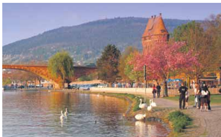
Mit dem Bau der Mainbrücke im 19. Jahrhundert entstand auch das Brückentor, die Uferpromenade ist bei Spaziergängern beliebt.

Wer sich für einen Ausflug nach Miltenberg interessiert, der kann sich auf der Internetseite der Stadt informieren. Diese ist unter www.miltenberg.de zu erreichen. Alternativ kann die Tourist-Information auch telefonisch unter 09371/4041-19 erreicht werden.