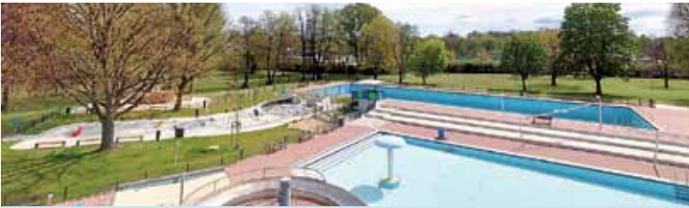
Die neue Kleinkindanlage kann endlich genutzt werden.

Neue Kleinkindanlage wird zur Nutzung freigegeben