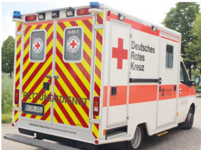
Rettungswagen des DRK-Erzhausen (Bild: DRK Erzhausen).

(Erzhausen, STS) Am vergangenen Freitag, den 6. Mai 2022, kam es zu einem Brand in einem großen Weiterstädter Einkaufsmarkt. Entsprechend dem Einsatzstichwort „F3 – Großbrand in Sonderobjekt“ wurden die Feuerwehren der Stadt Weiterstadt, Griesheim und Pfungstadt, der Rettungsdienst sowie die DRK Gebietsbereitschaft Weiterstadt alarmiert. Durch das vorbildliche Verhalten der Marktmitarbeitenden war das Center bei Eintreffen der Einsatzkräfte bereits evakuiert, und es ging keine Gefahr für Menschen aus. Das Löschen des Brandes, die Kontrolle des Gebäudes sowie die Lüftung war daraufhin alleinige Aufgabe der Wehren.