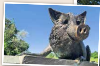
Auch ein GrünGürtel Tierchen findet sich auf dem alten Flugplatz.