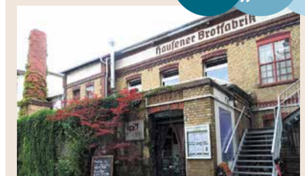
Die ehemalige Brotfabrik ist heute ein Ort für kulturelle Vielfalt.