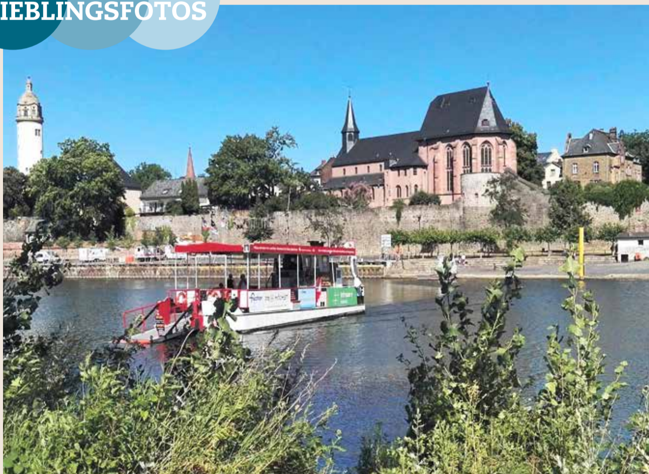
Eberhard Bacher hat uns dieses wunderschöne Foto von seiner Lieblingsecke in Frankfurt. Es zeigt die Fähre in Höchst mit dem historischen Stadtpanorama (Stadtmauer, Justinus-Kirche und Stadttor zum Schloßplatz). Vielen Dank dafür!