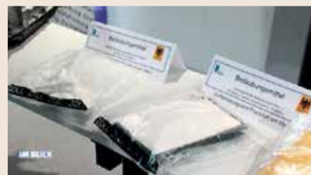
Fundstücke aus der Asservatenkammer des Hauptzollamts Frankfurt.

so alles beschlagnahmt wurde und von Walknochen über illegale Elektroschocker bis hin zum Holzmosaik als Rauschgiftversteck die spannendsten Funde wieder aus der Asservatenkammer geholt. Trotz Corona war 2021 ein erfolgreiches Jahr. So wurden Drogen im Wert von 129 Millionen Euro aus dem Verkehr gezogen. Maßgeblich zum Erfolg des Hauptzollamts tragen die Spürhunde bei. Die vierbeinigen Schnüffler werden in nur wenigen Monaten dazu ausgebildet, sehr unterschiedliche Zollgüter zu erschnüffeln. Außerdem werden sie inzwischen so trainiert, dass sie ohne Kratzen, Beißen oder Bellen eine verdächtige Person identifizieren. Der Plan für dieses Jahr ist, die Hundestaffel auf 30 aufzustocken, um noch mehr Zolldelikte aufklären zu können.