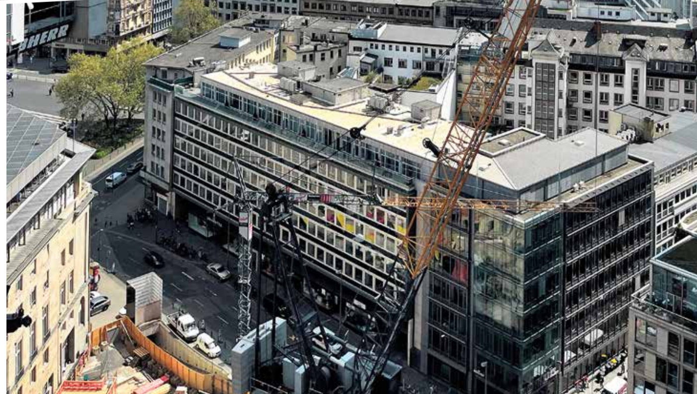
Fantastischer und – bis auf weiteres – einzigartiger Blick über die Stadt Frankfurt. Bis das zum Standard der Benutzer der Hochhäuser wird – dauert es noch ein wenig.