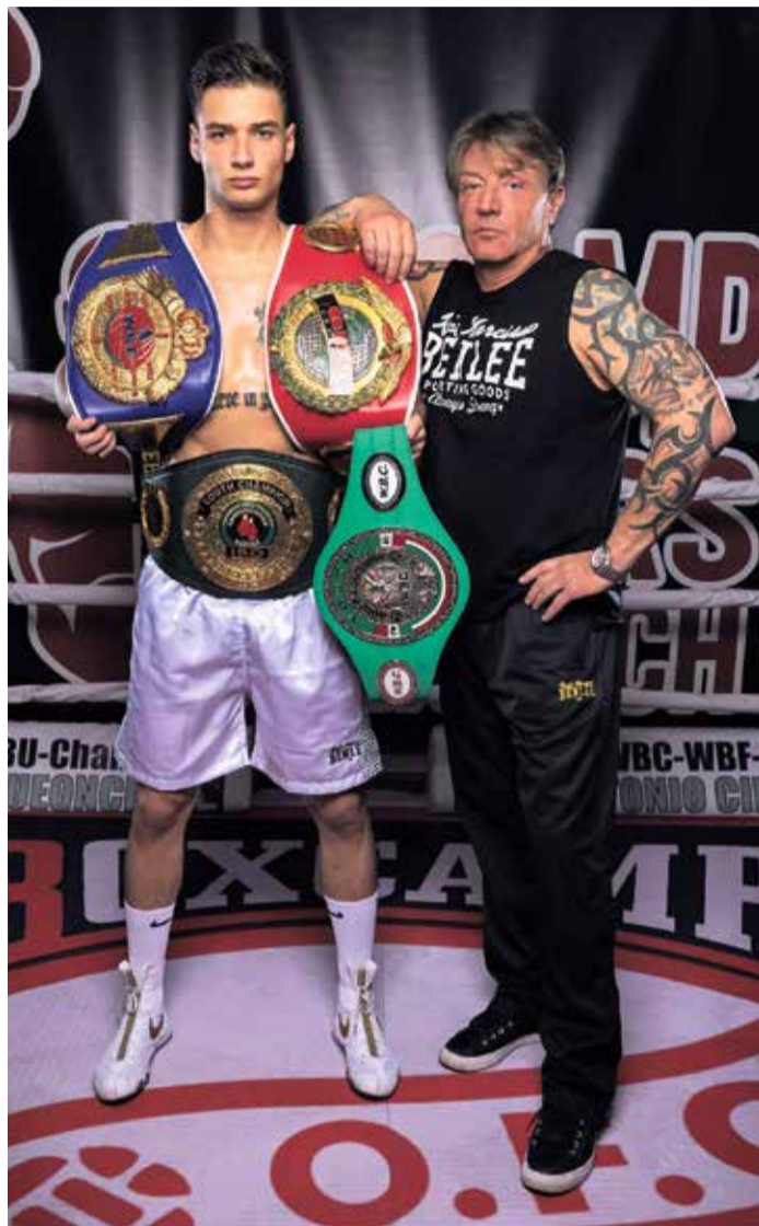
Luca „Rocky“ kann erstmals alle Welttitel holen.

Insgesamt sind elf Boxkämpfe (davon sechs WBC-Titelkämpfe) auf dem Bieberer Berg organisiert. Es steht ein spannender Abend bevor. Die letzten Karten sind noch im Verkauf erhältlich.