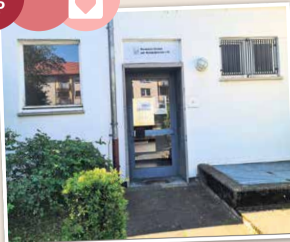
Nur ein kleines Schild über dem Eingang gibt einen Hinweis auf das Heimatmuseum in Bonames.