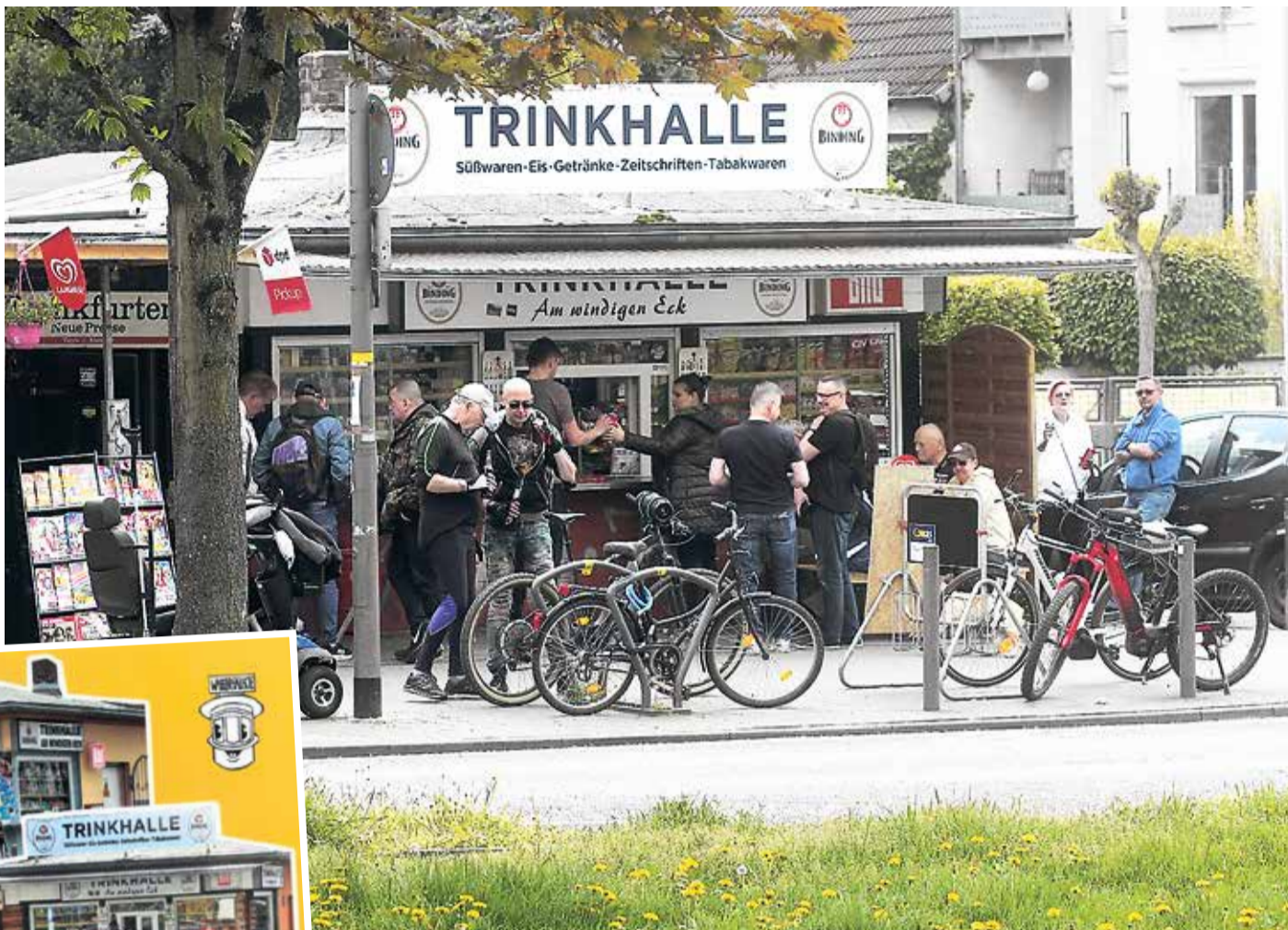
Ob Handwerker, Ortsvorsteher, Karussellbetreiber und Akademiker – hier gibt man sich die Hand.