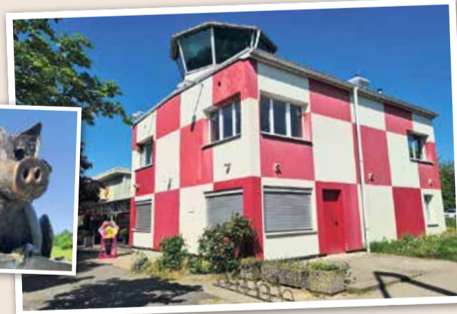
Das Towercafé ist bis heute ein beliebtes Ausflugsziel.