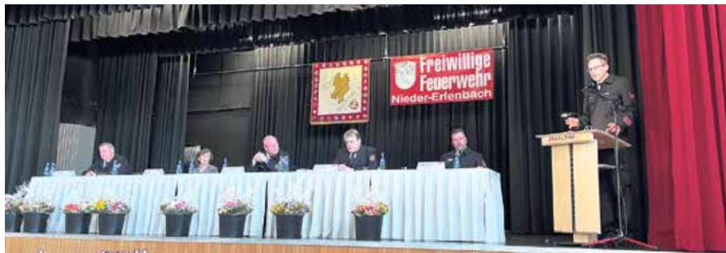
Kreisfeuerwehrverbandstag 2022 in Nieder-Erlenbach.

Wirft man einen genaueren Blick in den Koalitionsvertrag, sieht man, dass der Brandschutz sehr klein geschrieben wird. Es ist nicht ersichtlich, wie die zukünftige Finanzierung der Feuerwehr konkret aussehen soll. Der Verband befürchtet daraufhin eine massive Schwächung der gesamten Sicherheitsstruktur, was unter anderem eine Gefährdung für die Mitbürgerinnen und Mitbürger darstellen würde. Ein Konflikt, der viele Fragen aufwirft.