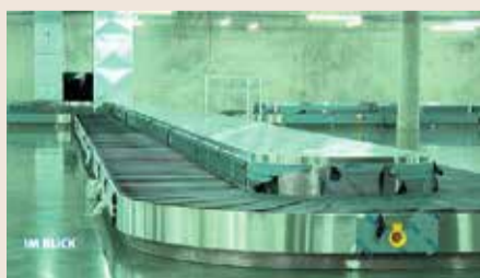
Gepäckband im neuen Terminal 3 des Flughafens Frankfurt

Check-In-Schalter, Einreisekontrollen und Gepäckrückgabe. Eigentlich gibt es im Flugsteig G des neuen Terminal 3 des Frankfurter Flughafens bereits alles, was man zum Fliegen braucht, zumindest fast alles. Denn, obwohl das Gebäude schon fertig ist, geht der neue Flugsteig erst einmal für voraussichtlich vier Jahre in den Ruhezustand. Die Inbetriebnahme ist verschoben auf Anfang 2026. Grund dafür ist die Corona-Pandemie. Bereits seit Ende 2015 wird im Süden des Frankfurter Flughafens für rund vier Milliarden Euro das neue Terminal 3 gebaut. In Zukunft sollen hier rund 19 Millionen Passagiere jährlich an- und abreisen. Sollten die Passagierzahlen entgegen der Erwartung vor dem Jahr 2026 wieder schlagartig in die Höhe schießen, könnte der neue Flughafenabschnitt auch deutlich früher an den Start gehen. Damit der neue Flugsteig G bis zur Inbetriebnahme einsatzbereit bleibt, werden in der Zwischenzeit verschiedene Instandhaltungs- und Wartungsmaßnahmen durchgeführt. Außerdem werden bereits bestehende Systeme wie die Gepäckförderanlage schon jetzt ausgiebig getestet. Insgesamt wird das neue Terminal über drei Flugsteige verfügen.