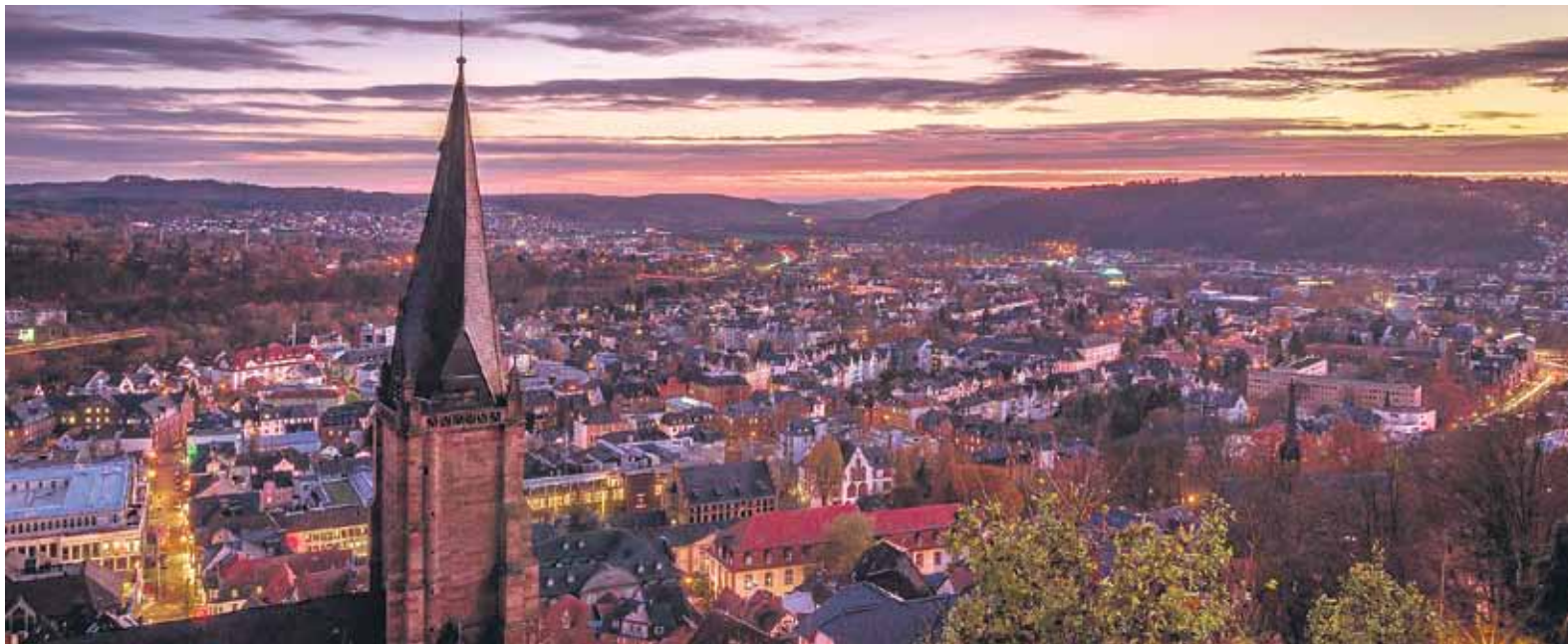
Die Marburger Altstadt bei Dämmerung.