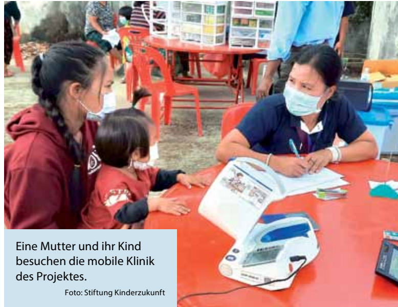
Eine Mutter und ihr Kind besuchen die mobile Klinik des Projektes.