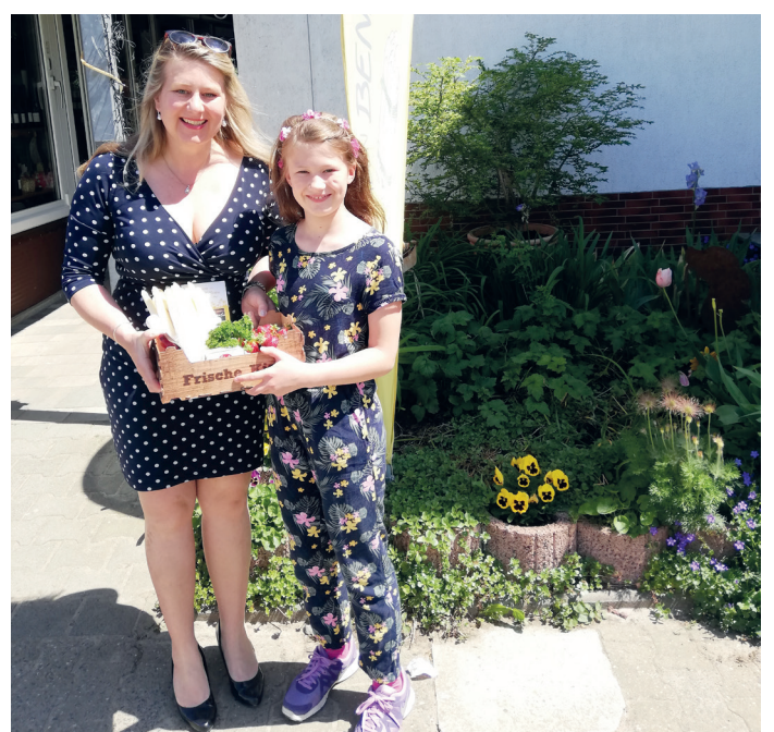
Drei glückliche GewinnerInnen durften sich den Gewinn direkt beim Bauernladen Benz abholen. Alle haben sich sehr darüber gefreut.