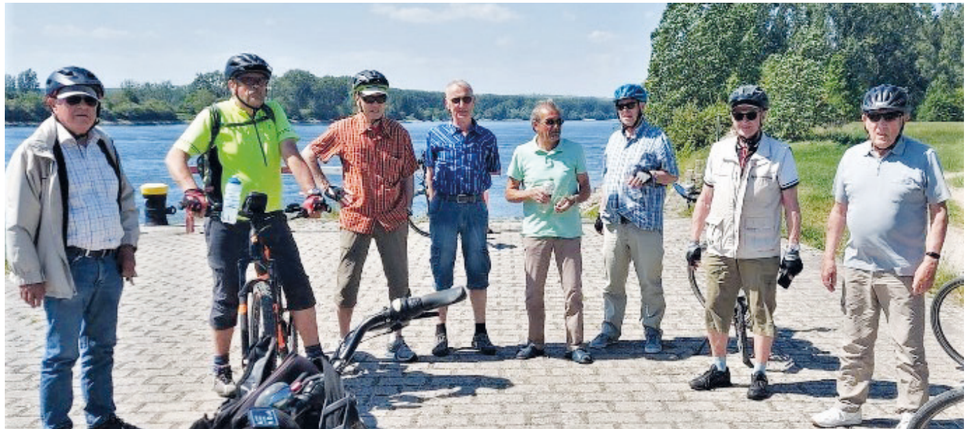
Die Erzhäuser Mittwochsradler vor dem Anleger der ehemaligen Rheinfähre nach Guntersblum.

(NOR) Wie der Name schon sagt, sind die Erzhäuser Mittwochsradler jeden Mittwoch mit dem Fahrrad unterwegs. Auch im Jahr 2022 wurden schon etliche Ziele in der näheren und weiteren Umgebung angefahren, wie z.B. die Odenwaldhöhlen in Groß-Gerau und Rüsselsheim, die Fischerhütte bei Roßdorf, der Biergarten Kalkofen, die Oberschweinstiege bei Frankfurt, verschiedene Naturfreundehäuser in der Umgebung sowie Cafés in Groß-Gerau, Götzenhain, Walldorf und im Helvetiapark Büttelborn. Auch weiter entfernte Ziele wurden in früheren Jahren angefahren, wie Touren zum Kühkopf, nach Seligenstadt, zur Hessenaue oder zu Radwegen an Nidda und Main. Jetzt war wieder einmal das Naturschutzgebiet „Kühkopf-Knoblochsau“ das Ziel, das