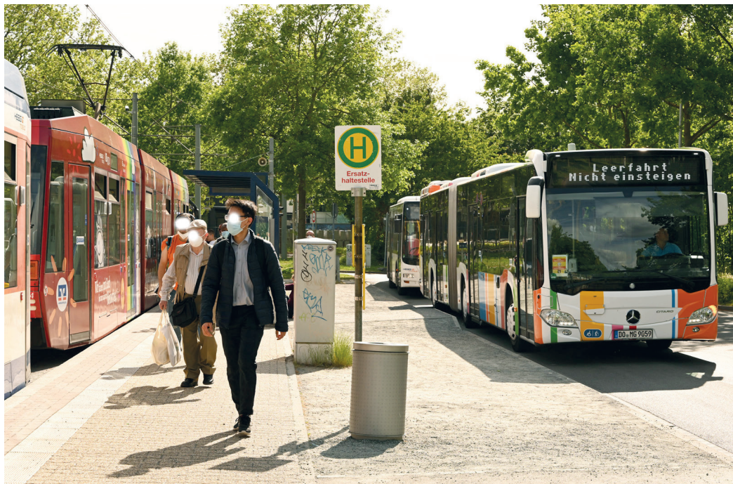
HEAG mobilo-Fahrgäste irrlichtern im Bürgerpark zwischen der selten fahrenden Schaukelbahn und zahlreichen Bussen, die ihre innere Leere auch noch mit „Leerfahrt“ auszeichnen.

(Darmstadt, PK) Im Prinzip hatten wir in der Vergangenheit einen 7-Minuten-Takt der Straßenbahnen nach Arheilgen und Kranichstein. „Im Prinzip“ deshalb, weil es der HEAG schon damals nicht gelang, die Linie 6 im Fahrplan sauber zwischen die 7/8-Fahrten zu platzieren. Dennoch wurde dieses Angebot angenommen, die Bahnen waren voll. Heute schaukelt nur noch alle Viertelstunde eine Straßenbahn zwischen Arheilgen und Kranichstein hin und her. Wer weiter will, muss am Messplatz oder am Nordbad in Busse umsteigen. Die stehen zwar auf den engen Straßen durchs Martinsviertel in allerlei Staus – auch von ehemaligen HEAG-Kunden, die aufs Auto umgestiegen sind – doch sie halten dort nirgendwo. Die Martinsviertler erleben eine Bustransit-Armada ohne jeden Nutzen, die Nordviertler können Ziele im Transitbereich nur erreichen, wenn sie am Schloss wieder in die gerade durchfahrene Gegenrichtung in andere Linien umsteigen. Der HEAG-Fahrgastbeirat hatte das bereits energisch beanstandet, die städtischen Fahrplanplaner interessiert das aber nicht. Die Umsteigesituation im Bürgerpark ist chaotisch. Zwar fahren die weitgehend leeren Gelenkbusse manchmal Stoßstange an Stoßstange ein, doch sie ändern häufig kurz vor der Haltestelle ihre Kennung in „Leerfahrt – nicht einsteigen“ und zeigen so den wartenden Fahrgästen eine lange Nase. In Gegenrichtung aus der Stadt heraus nach Kranichstein muss man – je nachdem, welchen Bus man gerade in der Stadt erwischt –