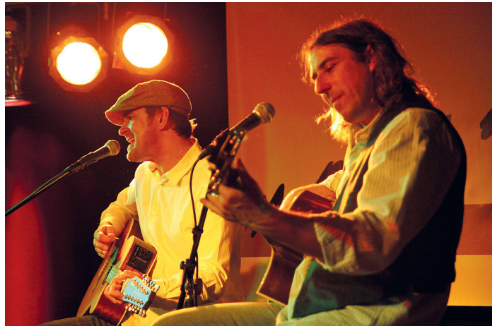
Pub Music beim Jubiläum: Molly Alone am 21. Mai in der Weinstube Kilian.