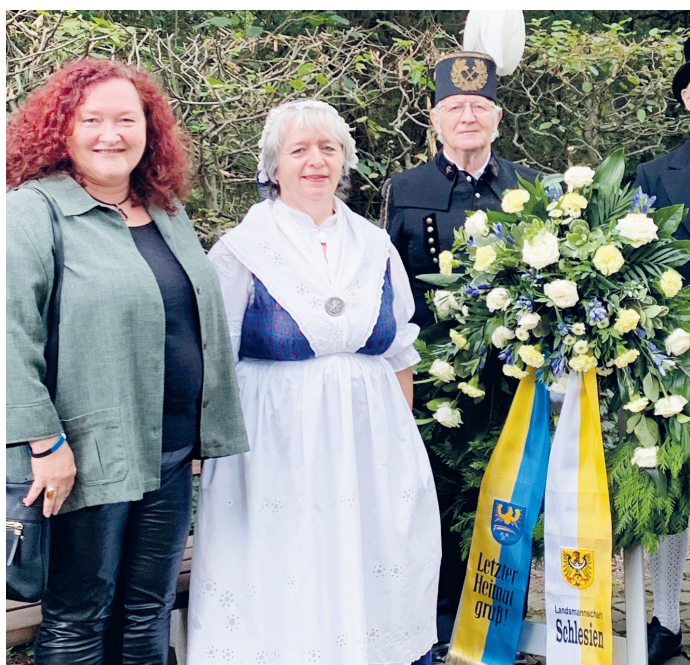
Das Bild entstand bei der offiziellen Kranzniederlegung am Waldfriedhof mit OB Patsch.

(Darmstadt, GS) Die Kreisgruppe Darmstadt feiert am Samstag, den 21.05.2022, ab 14:00 Uhr in der Liebfrauenkirche ihr großes Jubiläum. Heimatvertriebene, Spätaussiedler und Gäste sind dazu herzlich eingeladen. Der Verein organisiert 8 Veranstaltungen im Jahr und erhält somit die Tradition der alten Heimat. Weitere Informationen unter: 06151-374849.