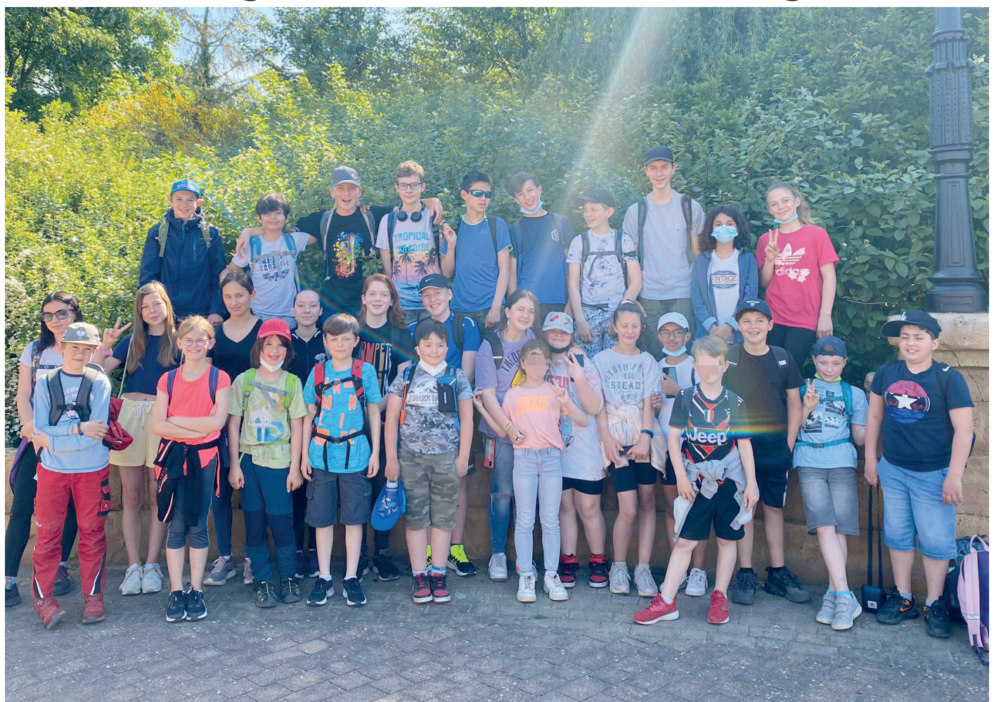
Das Sinfonische Blasorchester der TSG Wixhausen sorgt nicht nur für die musikalische Ausbildung seiner künftigen MusikerInnen, sondern fördert mit Angeboten abseits der Musik auch das Gemeinschaftsgefühl und damit das Zusammenspiel im Orchester. Nach dem tollen Auftritt im Muttertagskaffee genossen die Kinder der AG Klassenmusizieren und des Schülerorchesters den Ausflug in den Holiday Park und hatten viel Spaß.