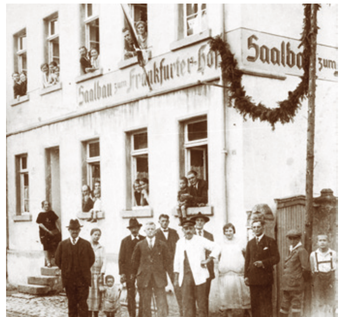
Aufnahme vom Saalbau zum Frankfurter Hof (beim Theodor). Foto um 1920.

Mit dem Wirtschaftsboom in der Kaiserzeit nach dem Krieg 1870/71, dem Ausbau der Bahnstraße und der Eröffnung einer Bahnhaltestelle damals ergaben sich bescheidene Entwicklungsmöglichkeiten für das immer noch recht abgeschieden liegende Dorf. Es zog täglich viele Männer in die nahen Städte Frankfurt und Darmstadt, wo es Arbeit gab, aber es zog keinen Städter nach Erzhausen, wo es nichts Besonderes zu sehen und nichts Erbauendes zum Erholen gab. „Kuhdörfer“ nannte man einst in städtischer Überheblichkeit solche Orte.