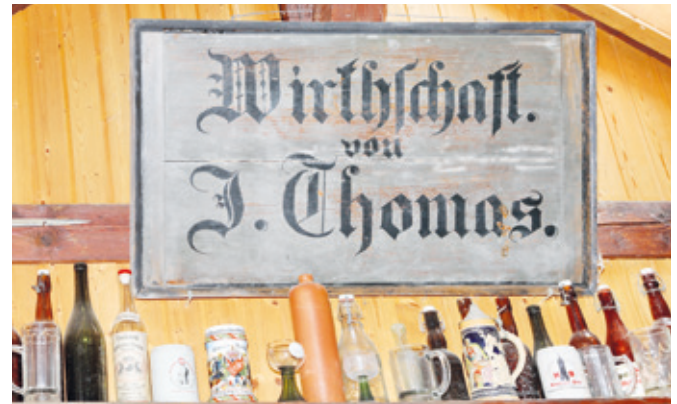
Das alte Schild im Museum.

(Erzhausen, HS) Im rechten oberen Ausstellungsraum des Museums hängt über alten Bierkrügen und Bügelflaschen das Schild „Wirtschaft von J. Thomas“. Das Schild stammt aus dem Unterdorf und ist das älteste erhaltene Wirtshausschild in Erzhausen. Wahrscheinlich stammt es aus der Zeit vor dem Ersten Weltkrieg. Die Historie der Wirtschaften in Erzhausen harret noch genauer Erforschung, aber allein dieses Wirtshausschild ist eine spannende Begegnung mit der Vergangenheit.