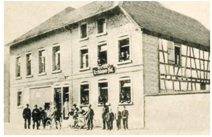
Die älteste Aufnahme einer Wirtschaft zeigt den Erzhäuser Hof (beim Katzuff). Postkarte um 1910.

Was hat es mit diesem Objekt Erzhäuser Kulturgeschichte auf sich? Schon die alten Griechen und Römer verwendeten Hauszeichen als Symbole um Orte der Gastlichkeit kenntlich zu machen. Bekannt aus dem Frankfurt Goethes sind Hausnummern wie Schwarzer Adler, Goldenes Faß oder Paradies. Hausnummern wurden dort erst 1761 eingeführt. Bis zum Ende des 19. Jahrhunderts gab es in Erzhausen keine Straßennamen, sondern nur fortlaufende Hausnummern. Symbole wie Schilder waren nützlich um sich von den vielen anderen Häusern abzuheben. Wo eine Wirtschaft oder ein Geschäft war wusste eigentlich jeder im Dorf.