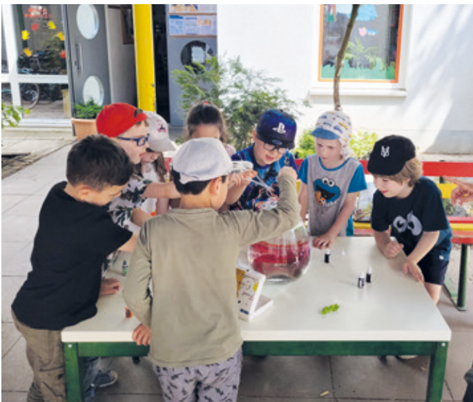
Kinder beim Experiment.

Was schwimmt und was sinkt in einem vollgelaufenen Waschbecken? Wie fühlt sich