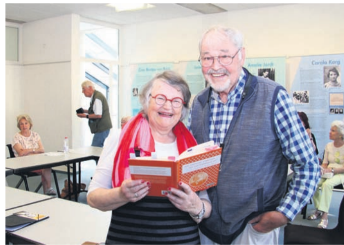
Tenor der Gäste: Er hat sich gelohnt, der kurze Weg „vor die Haustür“ zu Verskünstler Stoltze.