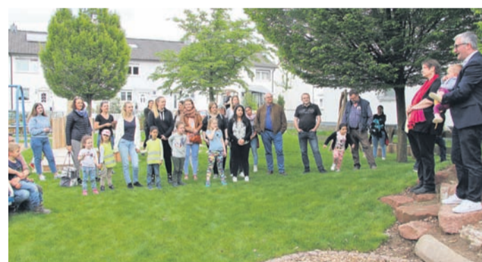
Ein schicker Vorzeige-Kandidat ist entstanden, ein Musterknabe, einer der attraktivsten Spielplätze, die Rödermark zu bieten hat.

„Der Platz ist eine Bereicherung. Viele Jung-Rödermärker werden davon profitieren“, betonte der Bürgermeister. Sein Hinweis: „Es gab zwar coronabedingt einige Verzögerungen bei der Umsetzung des Projekts, doch umso schöner ist das Ergebnis, das wir nunmehr vor Augen haben: Ein Areal mit vielfältigen Anregungen für die Sinne und zur Förderung der Motorik.“ Auf Sand- und Rasenflächen können die Kleinen buddeln, schaukeln und rutschen. Für ältere Kinder gibt es eine Klet-