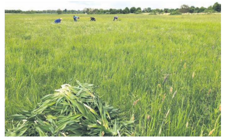
Die NABU-Aktiven beim Arbeitseinsatz.

Die Nebenerwerbslandwirtin Mechthild Zöller aus Ober-Roden pflegt einige der artenreichsten und schönsten Wiesen Rödermarks, darunter Wiesen, die praktisch noch nie gedüngt wurden und deshalb noch außerordentlich artenreich sind. Auf der größten dieser Wiesen sind die Bestände der Herbstzeitlosen massiv angewachsen. Und hier kommt nun der ehrenamtliche Na-