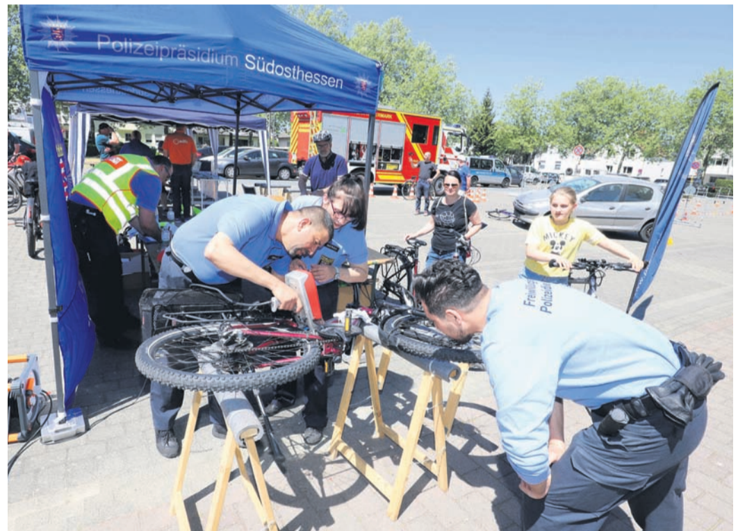
Gleich an zwei Ständen konnten Räder codiert werden.

Positives Fazit nach dem ersten „Tag der Rad-Verkehrs-Sicherheit“