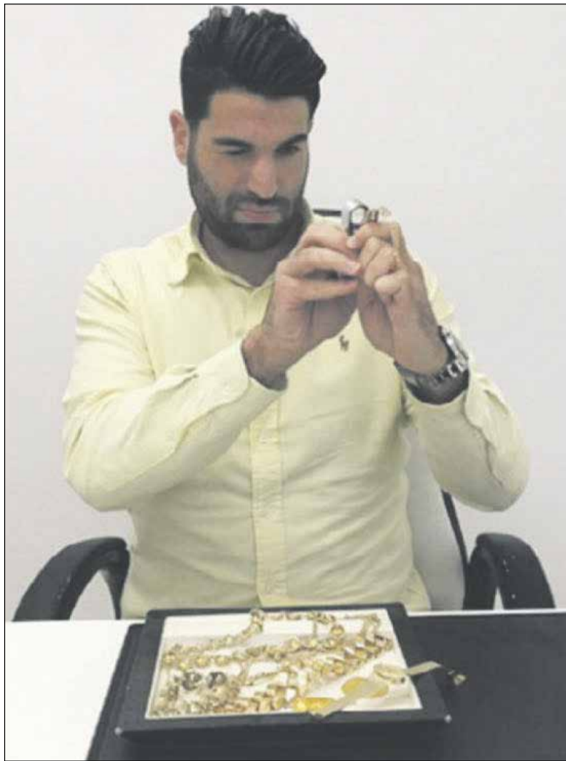
Ihr Spezialist für Goldankauf.