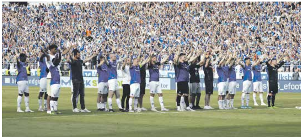
Großartiges Saisonfinale am Böllenfalltor.