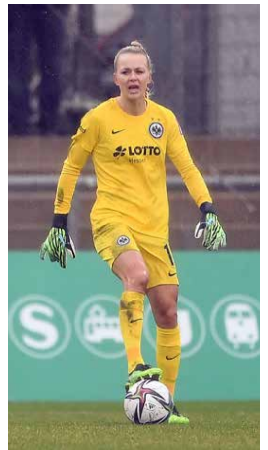
Torhüterin Merle Frohms wechselt zum VfL Wolfsburg