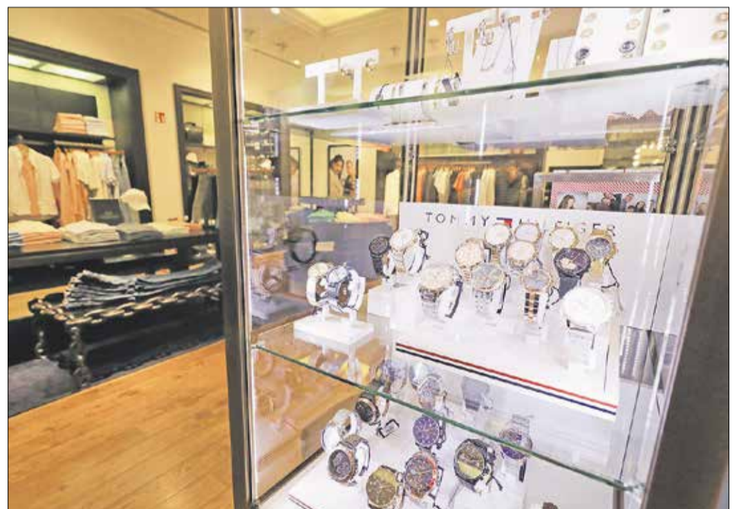
Auch Uhren und Schmuck gibt es im Tommy Hilfiger Shop.